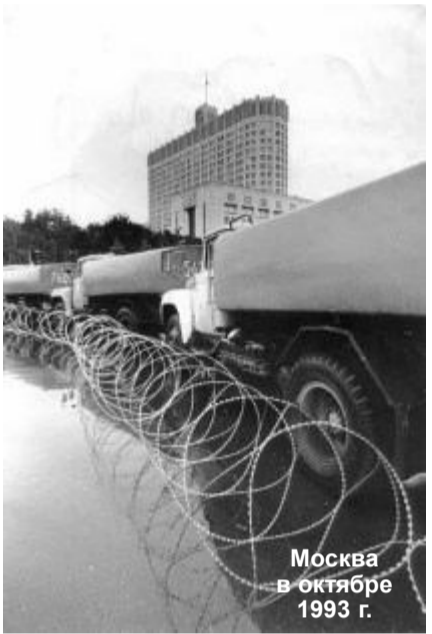
Москва в октябре 1993 г.

Буржуазная контрреволюция в нашей стране прошла три этапа.