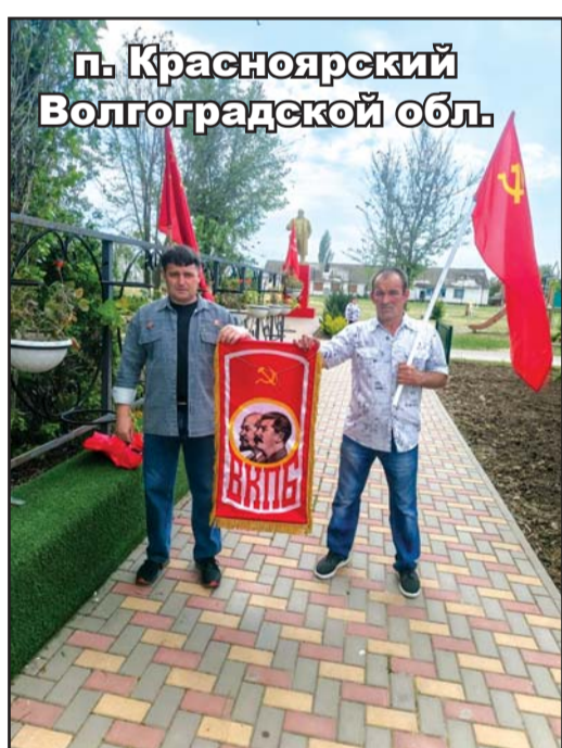
п. Красноярский Волгоградской обл.