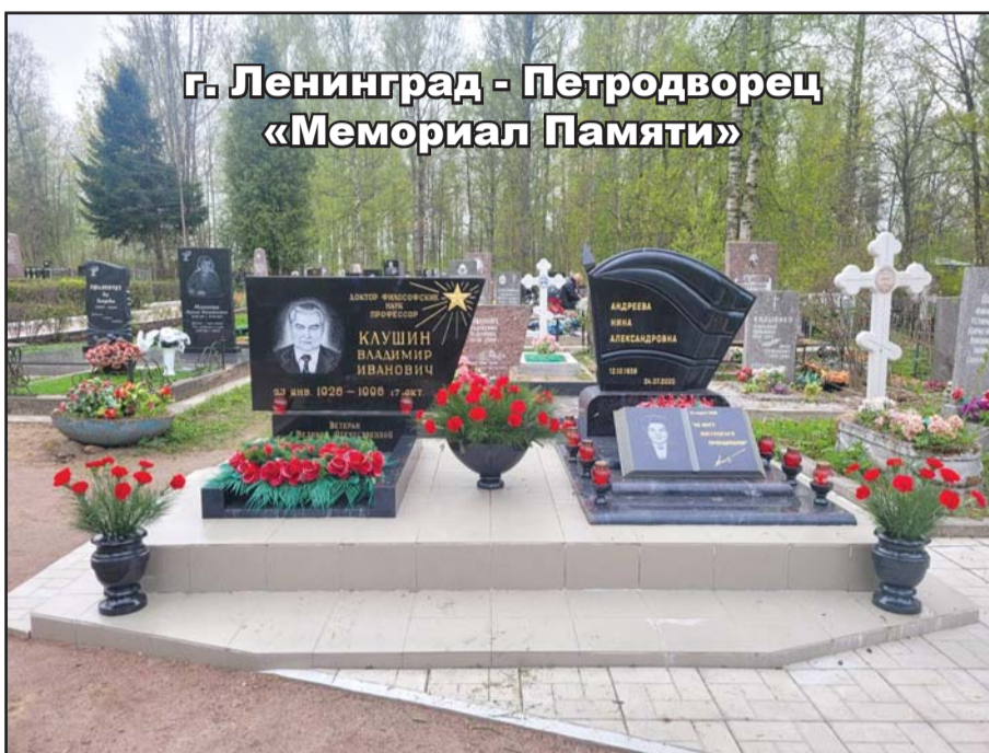
г. Ленинград - Петродворец «Мемориал Памяти»