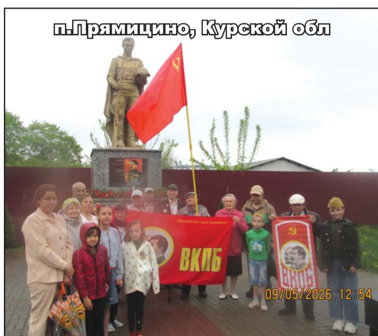
п.Прямицино, Курской обл