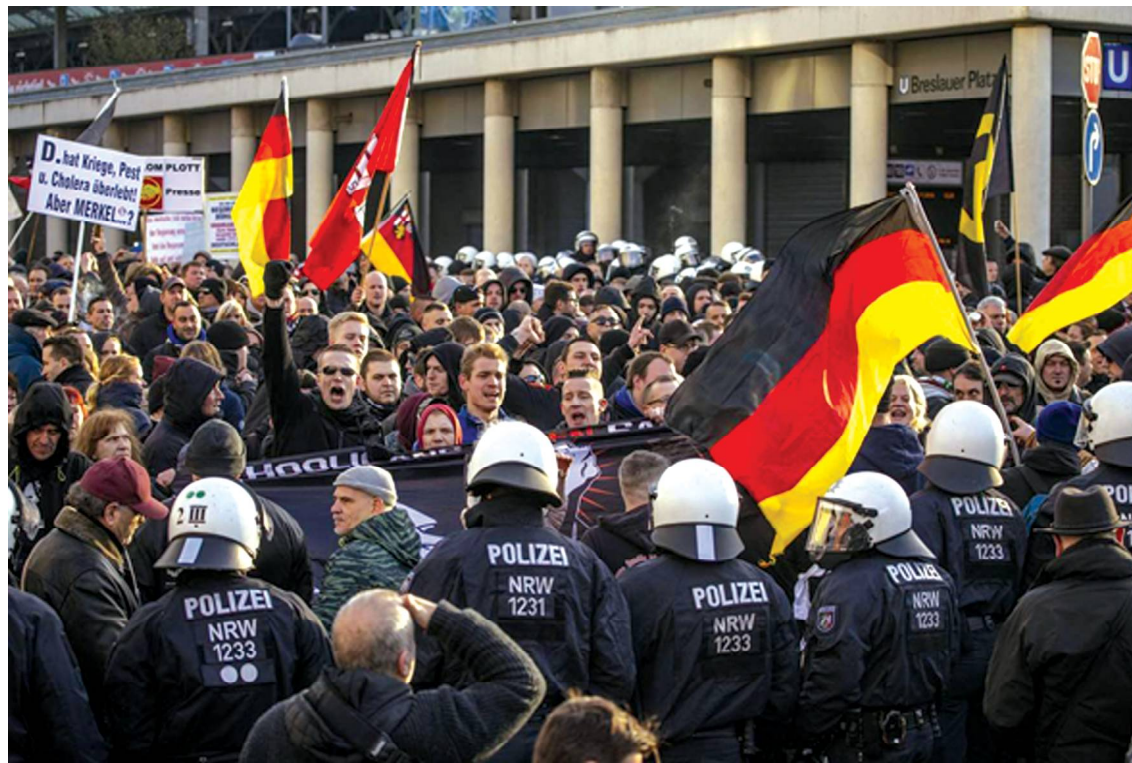
Протестное движение в Германии (2020г.)

Большинство жителей мира разочаровалось в капитализме и либеральной демократии западного образца, и не видят особых перспектив для себя в будущем.