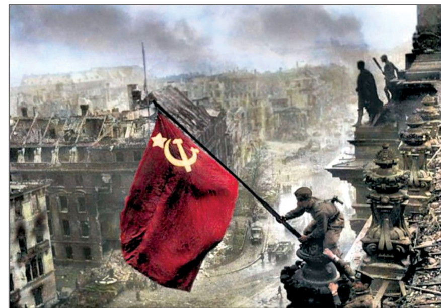
30 апреля 1945 г. советские воины РККА сержант М.А. Егоров и младший сержант М.В. Кантария в 21 час 50 минут водрузили Красное Знамя Победы над Рейхстагом в г. Берлине.

ВЕЧНАЯ СЛАВА ГЕРОЯМ, ПАВШИМ В БОЯХ С ВРАГОМ И ОТДАВШИМ СВОЮ ЖИЗНЬ ЗА СВОБОДУ И СЧАСТЬЕ НАШЕГО НАРОДА!