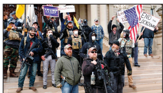
В США общее число безработных из-за коронавируса составило более 22 миллионов человек (на 16 апреля) из 159 млн трудоспособных граждан