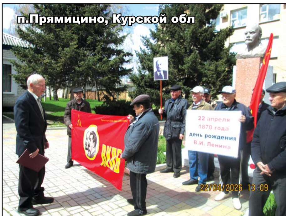
п.Прямичино, Курской обл