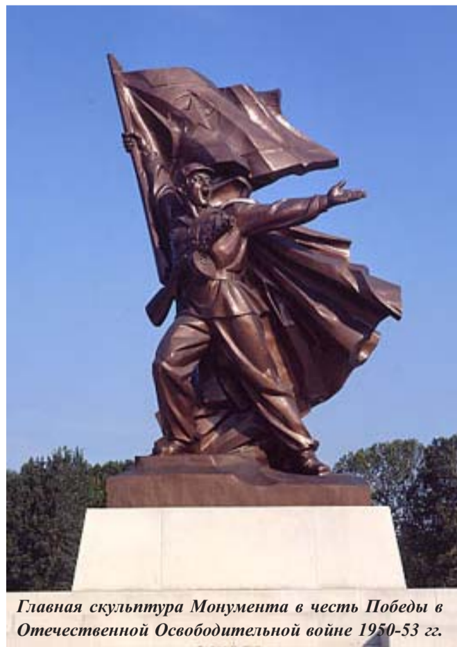
Главная скульптура Монумента в честь Победы в Отечественной Освободительной войне 1950-53 гг.

ном партизанских отрядов. Партизаны доставляли много хлопот японцам. Вооружённая борьба за освобождение Родины становилась всё мощнее и опаснее для японцев. Хотя конечно, воевать против вооружённой до зубов и прекрасно оснащённой оружием, боеприпасами и продуктами регулярной Квантунской армии было весьма сложно. Победа давалась нелегко. Но столь велика была нена-