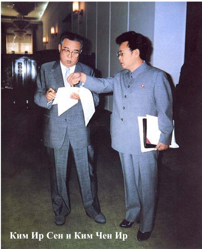
Ким Ир Сен и Ким Чен Ир

КНДР нет. Практически решена собственными силами продовольственная проблема в стране, где 80% площади составляют скалы, непригодные для земледелия. КНДР ныне – страна с развитой экономикой и энергетикой, способная сама решать все вопросы жизнеобеспечения государства в условиях длитель-