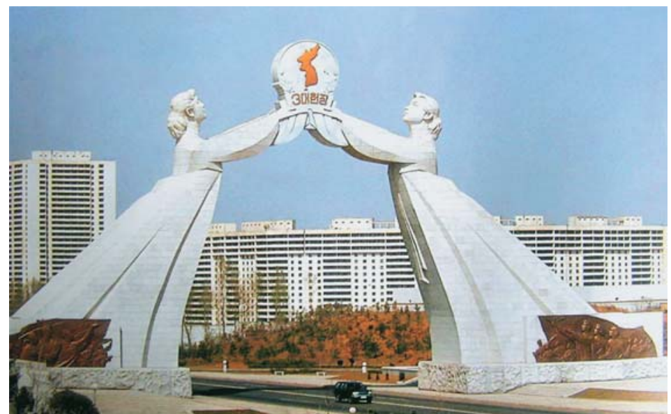
Монумент трех хартий объединения Родины

Н.А. Андреева Генеральный Секретарь ЦК ВКПБ 16 мая 2009 г.