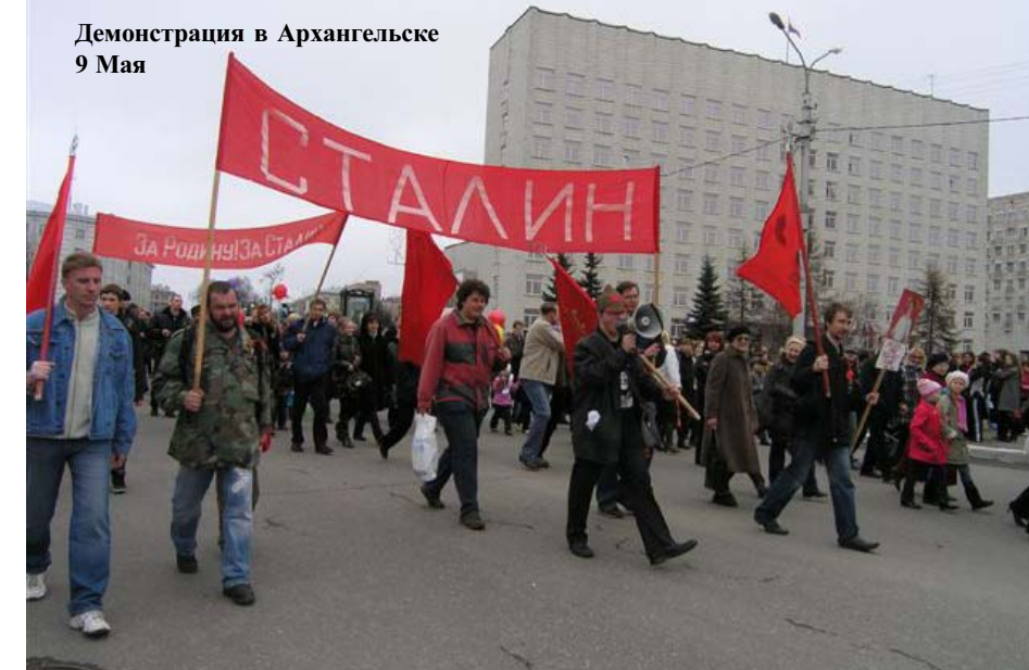
Демонстрация в Архангельске 9 Мая

Питтгорск. На площади им. В.И.Ленина у «Огня Вечной Славы» ранним утром 9 мая 2009 года, под моросивый дождик в 8 часов большевики г. Питтгорска выставили портреты К.Маркса, Ф. Энгельса, В.И. Ленина, И.В. Сталина, красные флаги, герб СССР и транспарант «Слава Иосифу Виссарионовичу Сталину — руководителю Победы советского народа над фашистской Германией 9 мая 1945 года». Был установлен штандарт Всесоюзной Коммунистической Партии Большевиков. К «Огню Вечной Славы» был возложен венок с цветами и красной лентой «Павшим За Нашу Советскую Родину! От Всесоюзной Коммунистической Партии Большевиков». В центре Мемориала установлен портрет И.В. Сталина, а вокруг — большое количество цветов. Распространение большевистских газет и листовок сопровождалось беседой о Победе советского народа в Великой Отечественной войне, о руководящей роли партии большевиков во главе с И.В. Сталиным. Детям вруча-