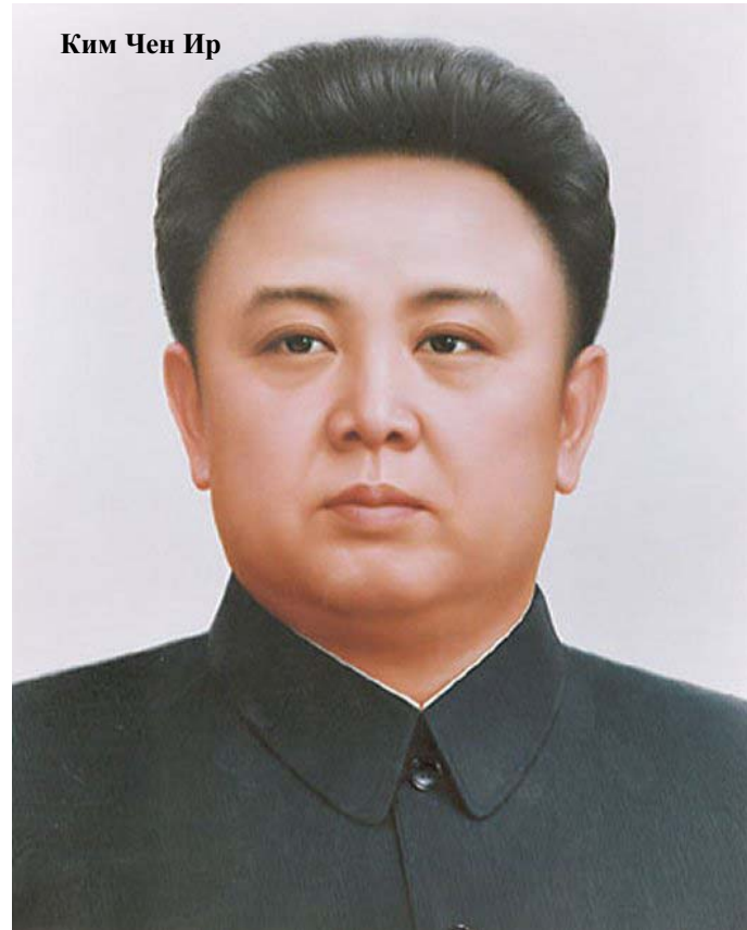
Ким Чен Ир

В июне в КНДР отмечаются две знаменательные даты: - 15 июня 2000 г опубликована Совместная Декларация Севера и Юга, - 19 июня 1964 г. день начала работы Великого Руководителя Товарища Ким Чен Ира в аппарате ЦК ТПК.