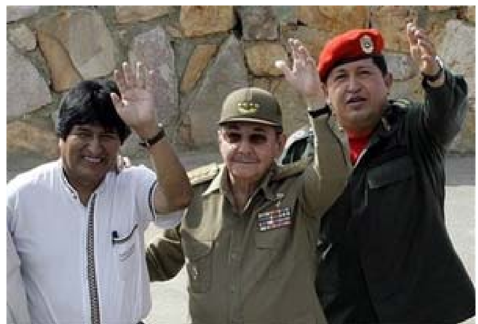
Президент Боливии Эво Моралес, Руководитель Кубы Рауль Кастро и Президент Венесуэлы Уго Чавес

Социальные завоевания и празднование 1 Мая в Венесуэле