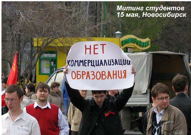
Митинг студентов 15 мая, Новосибирск

В пятницу 23 апреля 2010 года Госдума РФ в третьем чтении приняла самый главный антинародный закон за весь «путинский период» – «О внесении изменений в отдельные законодательные акты РФ в связи с совершенствованием правового положения государственных (муниципальных) учреждений». 28 апреля 2010 года Совет Федерации проголосовал за принятие законопроекта.