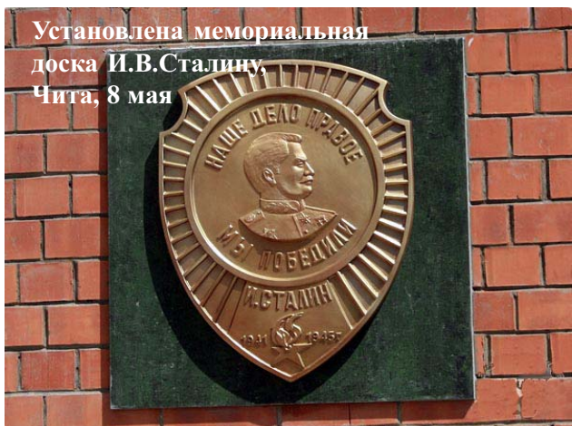
Установлена мемориальная доска И.В.Сталину, Чита, 8 мая