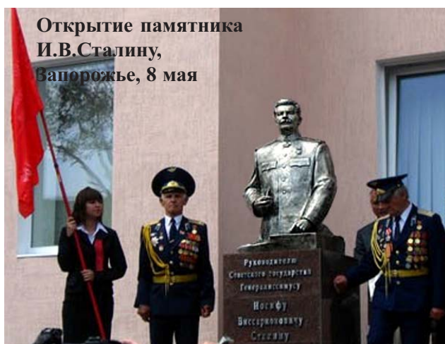
Открытие памятника И.В.Сталину, Запорожье, 8 мая