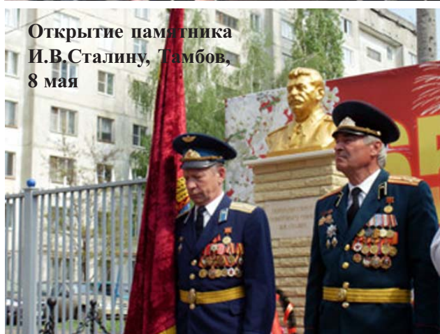
Открытие памятника И.В.Сталину, Тамбов, 8 мая