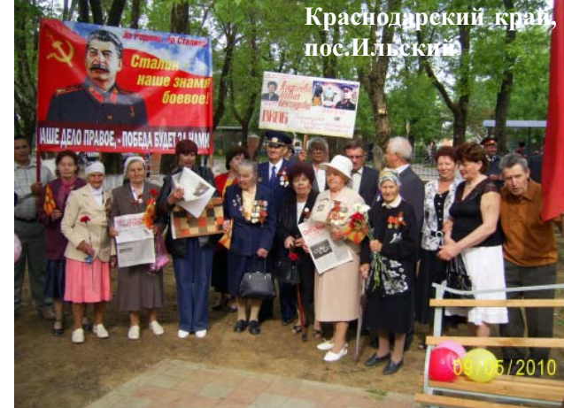
Краснодарский край, пос.Ильинский