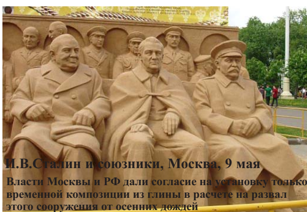
И.В.Сталин и союзники, Москва, 9 мая Власти Москвы и РФ дали согласие на установку только временной композиции из глины в расчете на развал этого сооружения от осенних дождей