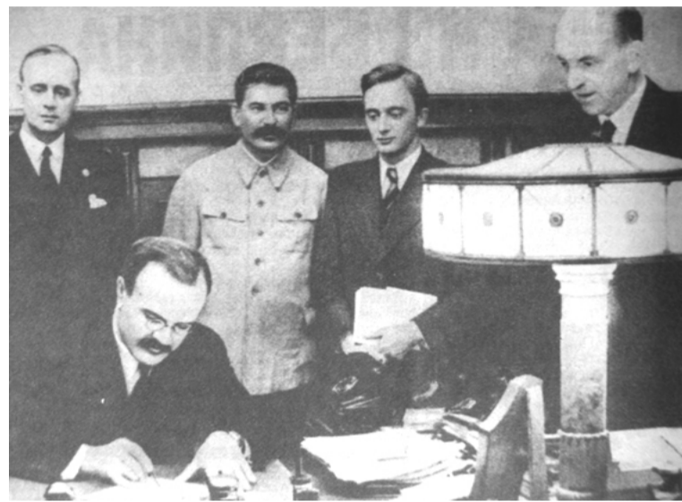
Подписание Договора о ненападении между Германией и Советским Союзом (Пакт Молотова-Риббентропа). Москва, 23 августа 1939 г.

С подачи англо-американской разведки и внутренней контрреволюции в СССР, начиная с конца 80-х гг. и по сей день не прекращается оголтелая клеветническая кампания вокруг советско-германского договора о ненападении 23 августа 1939 года, или пакта Молотова – Риббентропа, изображающая этот мирный пакт как «сговор» гитлеровской Германии и Советского Союза и перекладывающая ответственность пра-