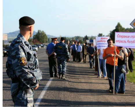
Алтайские рабочие, оцепленные ОМОНОм, пытались перекрыть федеральную трассу