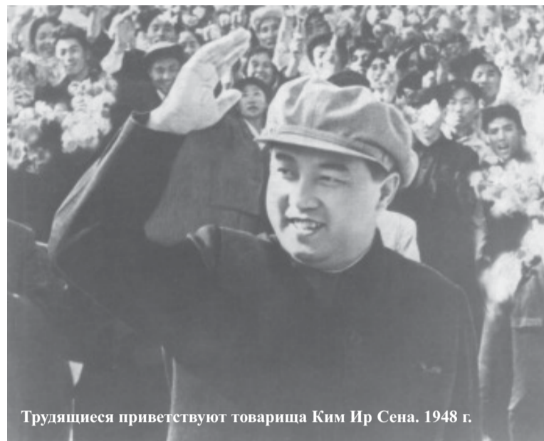
Трудящиеся приветствуют товарища Ким Ир Сена. 1948 г.

Более 100 лет тому назад известный классик индийской литературы Рабиндранат Тагор (1861-1941гг.) написал такое стихотворение, посвященное Корее: