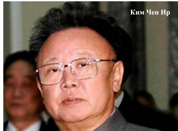
Ким Чен Ир

Во-первых, новые извлекаемые плутониевые стержни в полном объеме будут превращены в оружейные. На настоящий момент было пе-