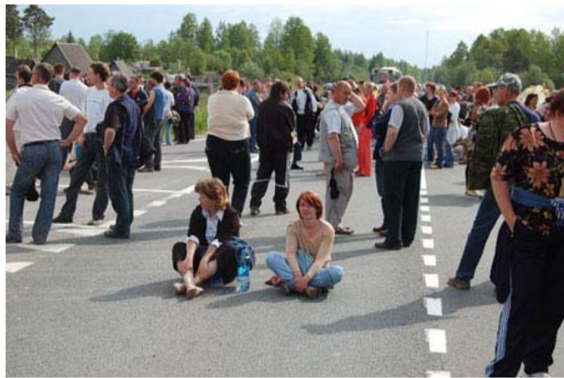
Работники градообразующих предприятий г. Пикалёво перекрыли федеральную трассу

ловины. В результате остановки производства сотни тысяч рабочих выбрасываются на улицу. Всего с начала октября численность официально уволенных достигла 384,2 тыс. человек, еще 1 млн. 248,7 тыс. – в вынужденном простое или работающие неполное рабочее время. Безработица в апреле 2009 г. по отношению к тому же периоду прошлого года возросла на 71,1%, поднявшись с октября 2008 г. с 5,8% до 10% в мае 2009 г. от численности экономически активного населения.