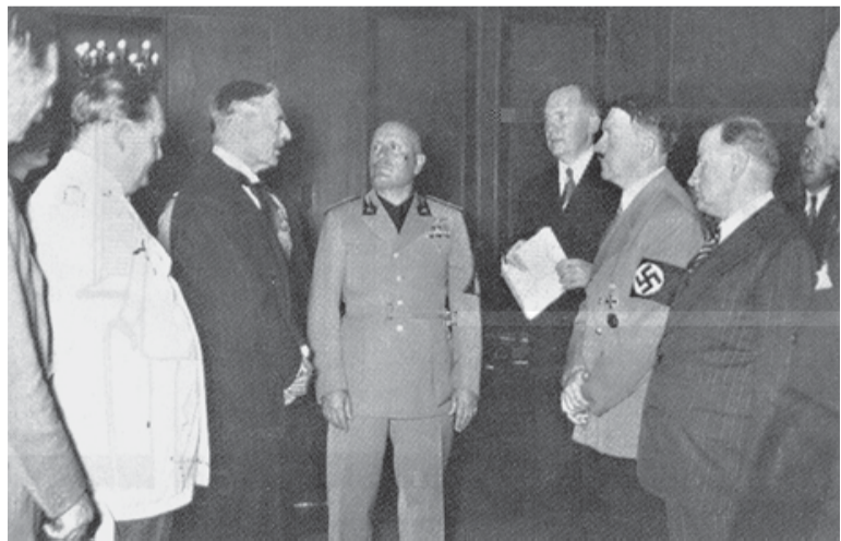
Участники Мюнхенскогоговора. Чемберлен, Муссолини, Гитлер, Деладье.

С помощью иностранного, главным образом американского капитала германская промышленность, особенно германский Стальной трест – «Ферейниге Шталверке», была широко реконструирована и модернизирована.