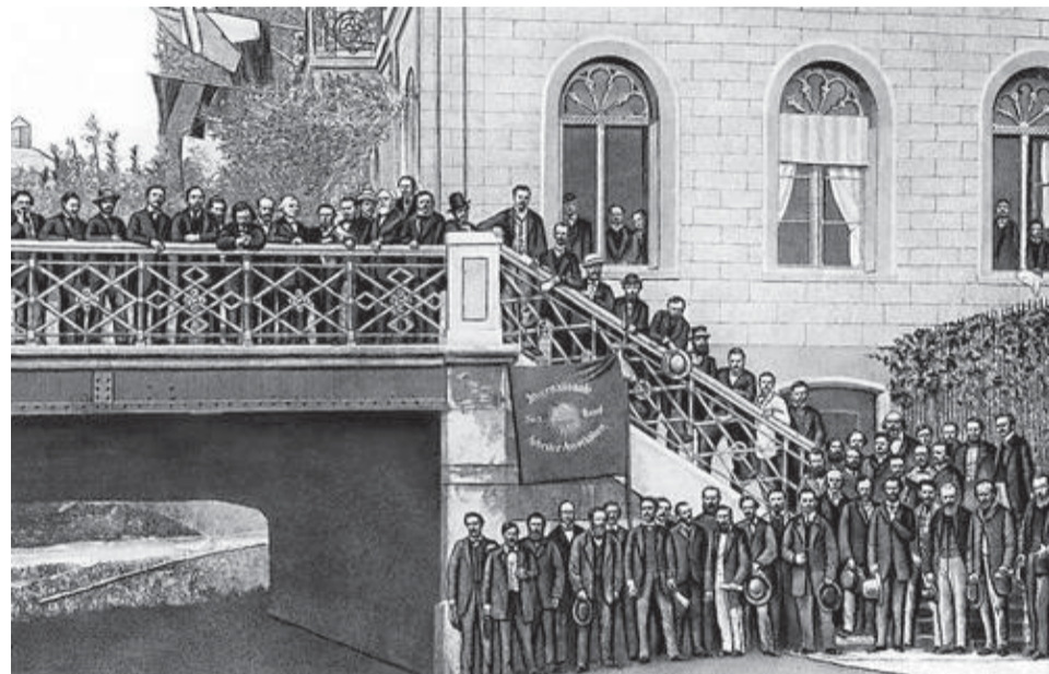
Делегаты Базельского конгресса I Интернационала. 6-11 сентября 1869 года.

«Объединяя рабочее движение разных стран, — писал В.И.Ленин, — стараясь направить в русло совместной деятельности различные формы непролетарского, домарксистского социализма (Мадзини, Прудон, Бакунин, английский либеральный тред-юнионизм, лассальянские качания вправо в Германии и т.п.),