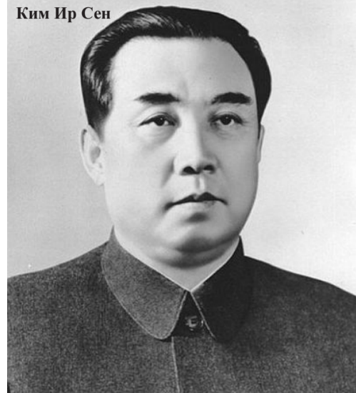
Ким Ир Сен

3 сентября 2003 года Товарищ Ким Чен Ир был переизбран на высший ныне пост – Председателем ГКО КНДР (на I сессии ВНС КНДР 11 созыва). Товарищ Ким Чен Ир является великим государственным и политическим деятелем современности, мудро и целеустремленно ведет корейский народ по пути построения зажиточного социалистического государства объединенной нации. Причём, в исключительно сложных условиях давления империалистического Запада на КНДР, объединившегося против социалистического государства. Трудовая партия Кореи, Государственный Комитет Обороны КНДР, славные Вооруженные Силы страны успешно решают задачи, поставленные перед ними Товарищем Ким Чен Иром. Поэтому нет преград, которые не взял бы народ КНДР под руковод-