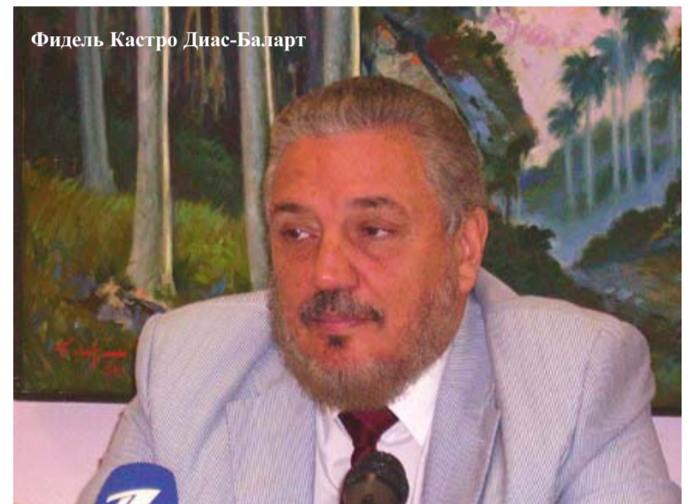
Фидель Кастро Диас-Баларт

вителями науки и образования в Курчатевском институте, в Московском государственном университете. По случайному совпадению в одном из российских университетов было принято решение о вручении степени почетного доктора лидеру Кубинской революции Фиделю Кастро Рус. Мне выпала привилегия получить от его имени эту почетную степень.