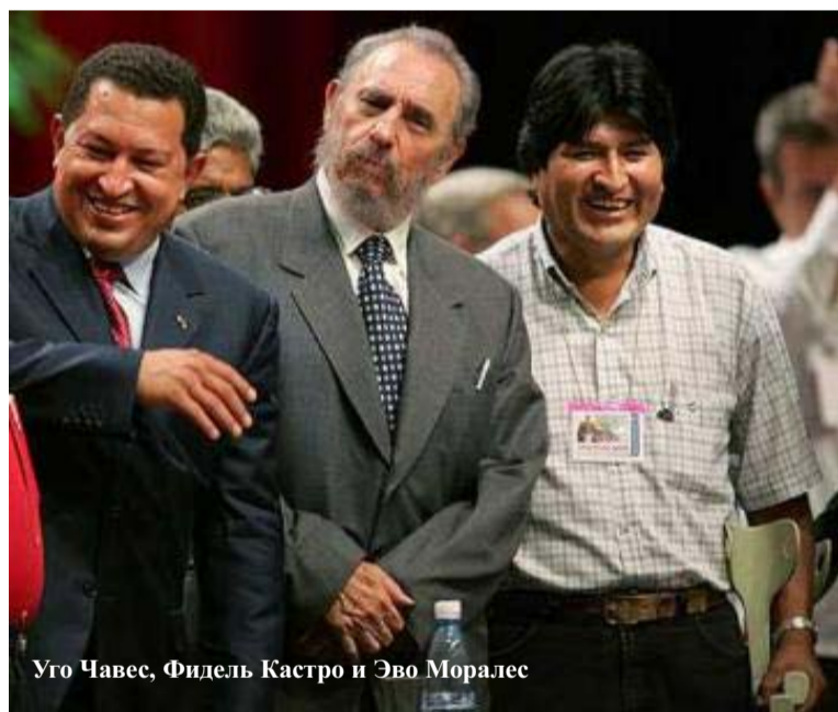
Уго Чавес, Фидель Кастро и Эво Моралес

Венесуэла обеспокоена обстановкой растущей мобилизации, следствием решения Вашингтона и Боготы (столицы Колумбии) установить еще четыре американские базы в соседней Колумбии. По мнению венесуэльского президента Уго Чавеса, размещение американских войск на военных базах в Колумбии несет угрозу всем южноамериканским странам, и в первую очередь Венесуэле, Эквадору и Никарагуа.