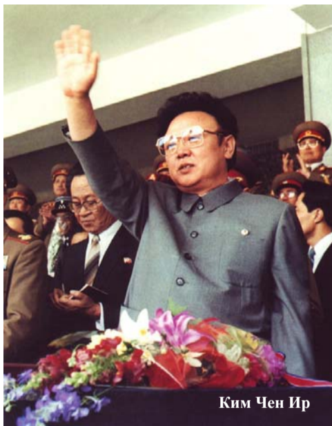
Ким Чен Ир

Ким Чен Ир является великим государственным и политическим деятелем современности, мудро и целеустремленно ведет корейский народ по пути построения зажиточного социалистического государства объединенной нации. Причём, в исключительно сложных условиях давления империалистического Запада на КНДР, объединившегося против социалистического государства. Трудовая партия Кореи, Государственный Комитет Обороны КНДР, славные Вооруженные Силы страны успешно решают задачи, поставленные перед ними Товарищем Ким Чен Иром. Поэтому нет преград, которые не взял бы народ КНДР под руковод-