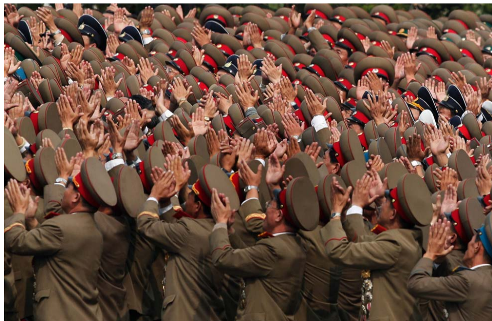
Участники военного парада в честь 65-летия Трудовой партии Кореи аплодируют лидеру КНДР Ким Чен Иру