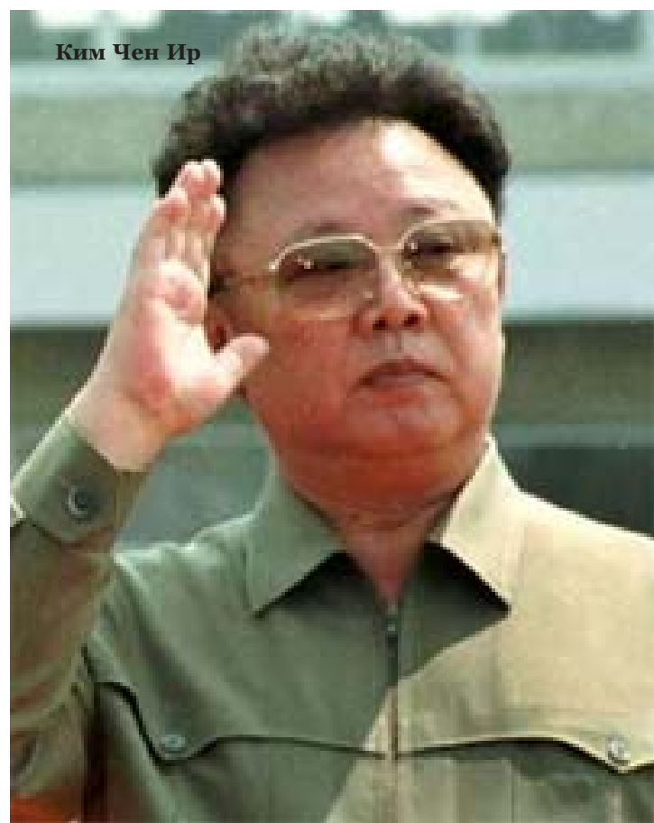
Ким Чен Ир

- 24 декабря 1991 г. назначение Товарища Ким Чен Ира на пост Верховного Главнокомандующего Корейской Народной армии,