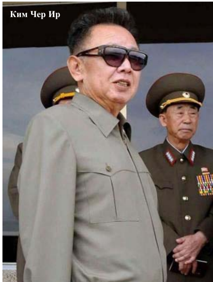
Ким Чер Ир

24 декабря 1917 г. родилась Ким Чен Сук – героиня антияпонской борьбы, жена Великого Вождя товарища Ким Ир Сена и мать Великого руководителя товарища Ким Чен Ира.