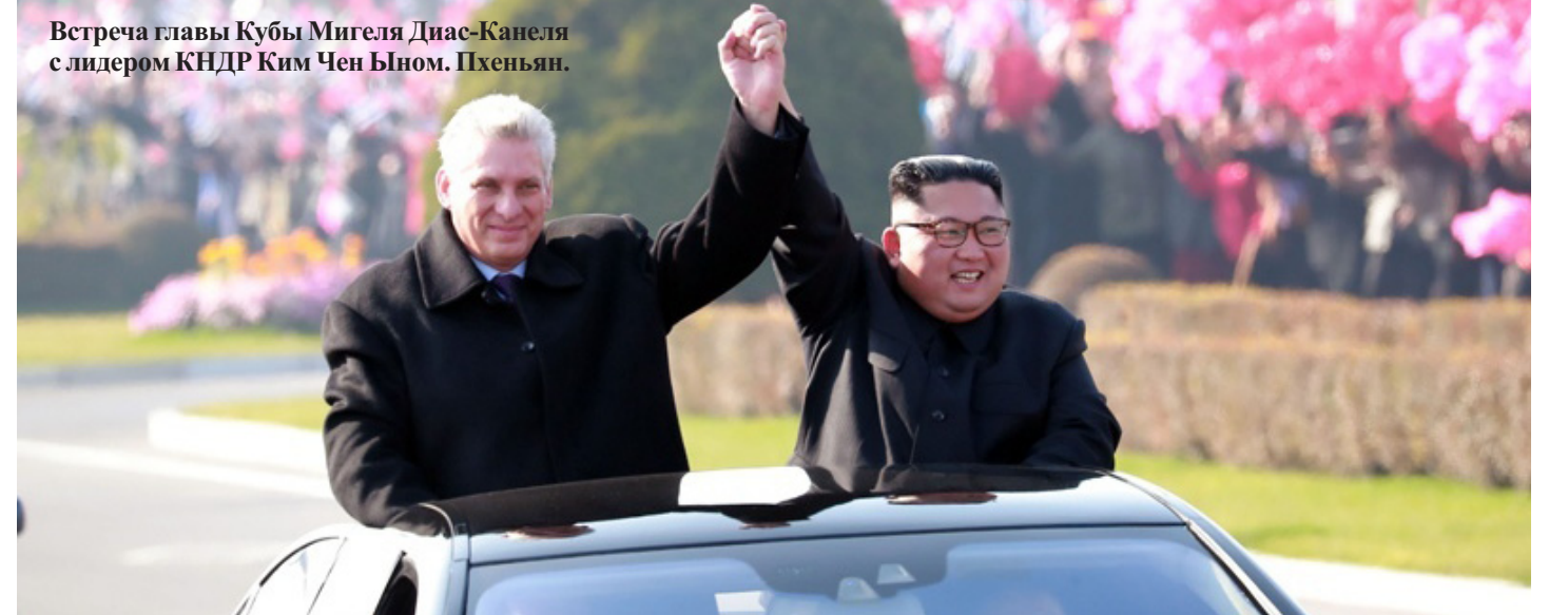
Встреча главы Кубы Мигеля Диас-Канеля с лидером КНДР Ким Чен Ыном. Пхеньян.

Пусть год 60-летия победы революции станет ещё одним успешным годом для кубинского народа в его движении к намеченным целям.