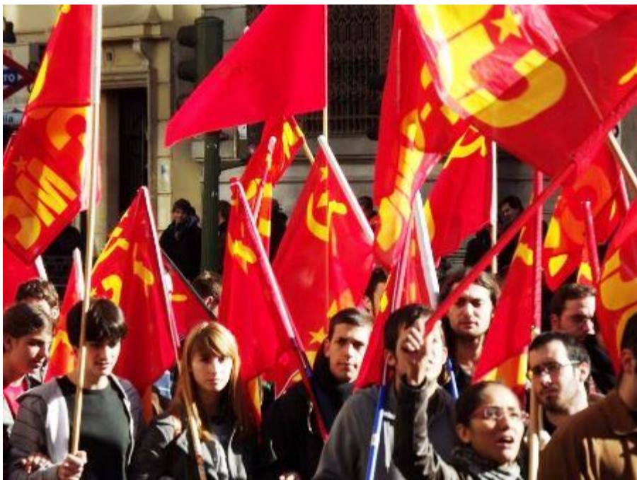
Молодые коммунисты Испании

После смерти фашистского диктатора Франко в 1975 году Испанское государство произвело «косметический ремонт», обзаведясь «витриной», вроде парламентских выборов и буржуазной многопартийности. Но под спудом всей этой фикции продолжает сохраняться жесточайшая полицейская диктатура, обрушивающая репрессии на любые попытки оказания реального сопротивления капитализму. В стране попеременно формируются кабинеты министров то правая «Народная партия», то Испанская социалистическая партия, стоящая на позициях социал-фашизма. Но от перемены физиономий министров на телеэкранах суть режима не меняется.