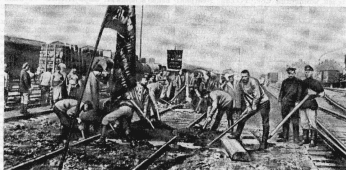
Массовый субботник на Московско-Казанской железной дороге.

храбрости и выносливости, отстаивая завоевания социалистической революции. Медленно и трудно идет изживание партизанщины, преодоление усталости и распушенности, но оно идет вперед несмотря ни на что. Героизм трудящихся масс, сознательно приносящих жертвы делу победы социализма, вот что является основой новой, товарищеской дисциплины в Красной Армии, ее возрождения, укрепления, роста.