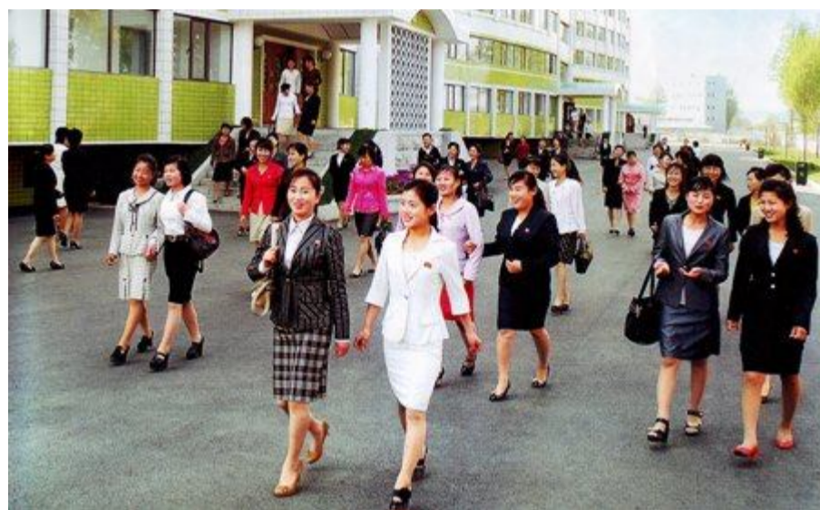
Работницы текстильного комбината после смены

За 66 лет социалистического пути КНДР превратилась в страну всеобщей грамотности. Лозунг – кадры решают всё! – лежит в основе развития всего общества. Сегодня в КНДР на высокий уровень подняты научные исследования в самых разных областях. Создано много научно-исследовательских институтов. Огромное внимание в стране уделяется быту корейского гражданина и его здоровью. Решена задача высококвалифицированного медицинского обслуживания жителей самых отдалённых от столицы районов. Особое внимание в стране уделяется подрастающему поколению, состоянию его здоровья и воспитанию высококвалифицированного гражданина, достойного продолжателя дела их отцов и дедов. Очень большое внимание уделяется гражданскому строительству как в городах, так и на селе. Каждая семья живёт в бесплатно предоставленной ей государством отдельной благоустроенной квартире. И высокая на сегодня планка жизни гражданина КНДР продолжает повышаться. Столица КНДР город Пхеньян считается одним из самых благоустроенных, экологически чистых и красивых городов мира.