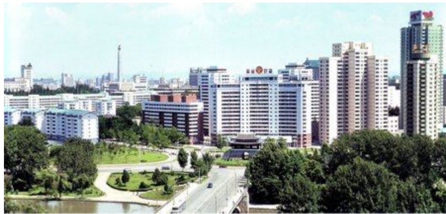
Жилой массив в Пхеньяне. В КНДР активно развивается жилищное строительство, квартиры трудящиеся получают бесплатно

9 сентября Корейская Народно-Демократическая Республика торжественно празднует своё славное 66-летие. Молодая Социалистическая Корея после освобождения территории Кореи от японского ига поднялась в 1948 году на обломках нищенских хижин бедняков в условиях всеобщей разрухи, острой нужды, отсутствия промышленных предприятий, научно-технических и профессиональных кадров (почти полная безграмотность населения и всего лишь 12 человек с высшим образованием на всю Корею), наличия хилого мелкотоварного малопродуктивного сельского хозяйства. Вот что оставило корейскому народу более 50-летнее господство японских оккупантов. Явившаяся миру новая Корея распрямила плечи и начала строительство новой жизни на прекрасной земле утренней свежести. Народ, изгнавший японских завоевателей со своей земли под руководством Великого Вождя товарища Ким Ир Сена, сам добровольно выбрал своей дальнейшей исторической путь – путь социализма, путь независимости, самостоятельности, путь опоры только на свои собственные силы, путь чужде, путь сонгун. Ким Ир Сен, проложив путь сонгунской революции, выдвинул идею приоритета оружия, приоритета военного дела, с империалистическими агрессорами решительно бороться с оружием в руках, на вооружённую агрессию отвечать справедливой освободительной войной.