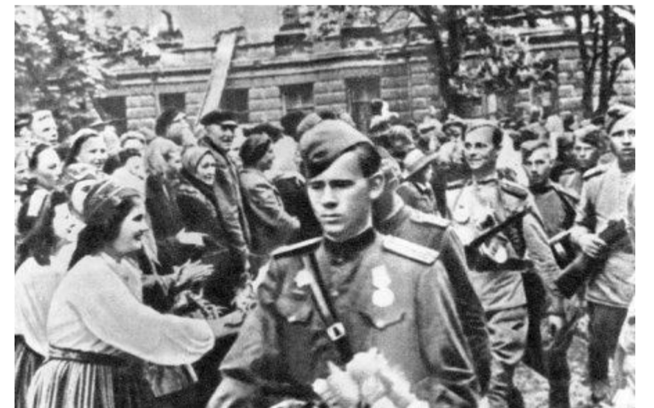
жители Таллина приветствуют советских воинов

Проживающие сегодня в Латвии, Литве и Эстонии ветераны Великой Отечественной войны семидесятью годовщиной освобождения Прибалтики от гитлеровских завоевателей встречают в нелёгкое время. Волей политической элиты этих стран из защитников Родины они в односторонние превращены в «окупантов», лишены заслуженных прав, зачастую подвергаются судебному преследованию. Это происходит на фоне реализуемой Вильнюсом, Ригой и Таллином политики героизации бывших военнослужащих эсэсовских формирований, а также местных пособников нацистов, включая предоставление им государственных дотаций. С запретом советской символики и сносом советских памятников в Прибалтике вернулась фашистская идеология. Национализм в этих странах сочетается с хулиганством буржуазных властей перед западными хозяевами, как и в тридцатых - сороковых годах прошлого столетия.