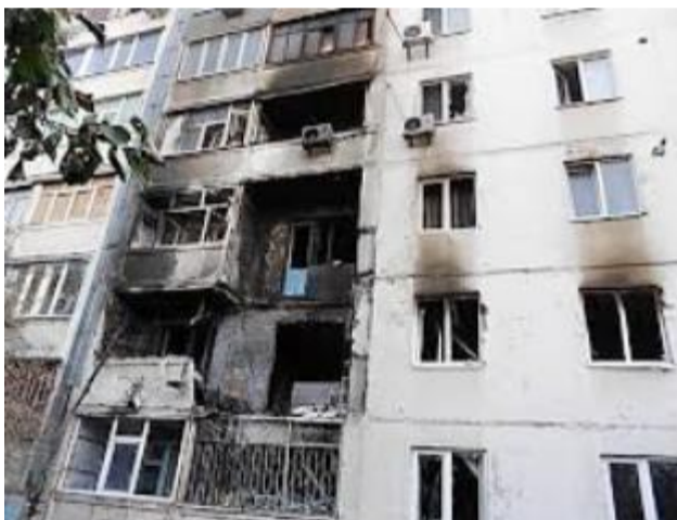
Последствия обстрела Луганска войсками хунты