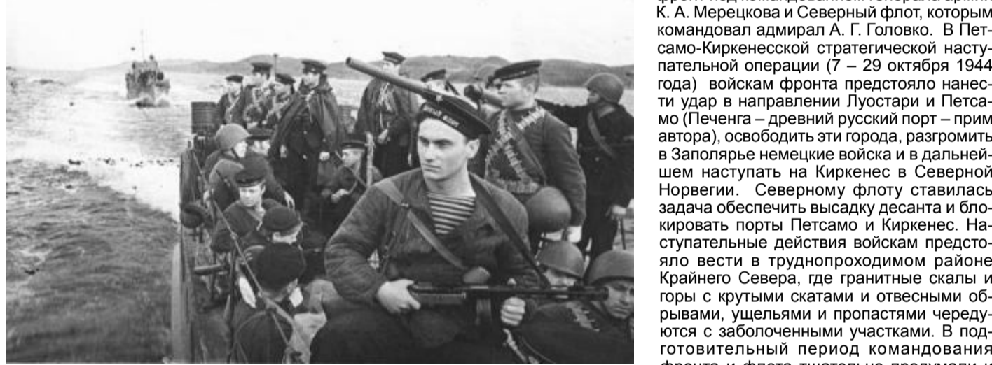
Высадка советского десанта в Петсамо, 1944 г.

Задачу разгрома немецко-фашистских войск в Заполярье Ставка Верховного Главнокомандования возложила на Карельский фронт под командованием генерала армии К. А. Мерецкова и Северный флот, которым командовал адмирал А. Г. Головко.