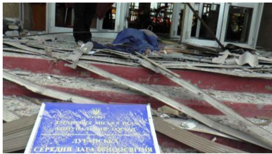
Последствия обстрела Луганска войсками хунты. Здание школы № 51

Одним из немногих плюсов «Минских соглашений» можно назвать обмен пленными, благодаря чему удалось вызволить из застенков украинской хунты ряд ополченцев и политических активистов. Необходимо отметить принципиальную разницу между пленными. Украинские солдаты, бывшие в плену у Ополчения, выглядят нормально – они не истощены, обычно одеты, вполне целы внешне и зачастую не горят желанием возвращаться на родную территорию, где их ждёт либо тюрьма, либо повторная отправка на фронт. Зато ополченцы, побывавшие в плену у киевской хунты, не всегда могут самостоятельно пройти несколько метров до своих – так они избиты и измучены.