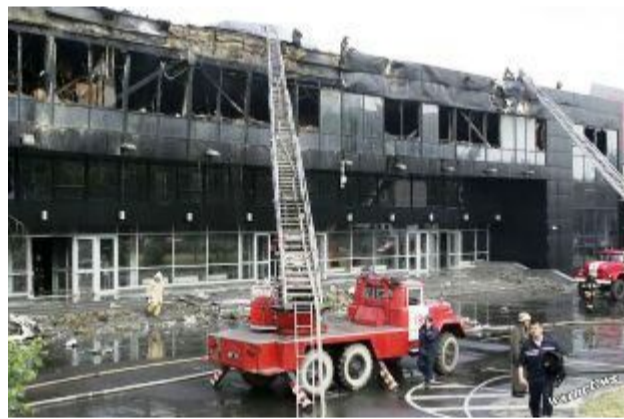
Донецкий аэропорт после украинского обстрела