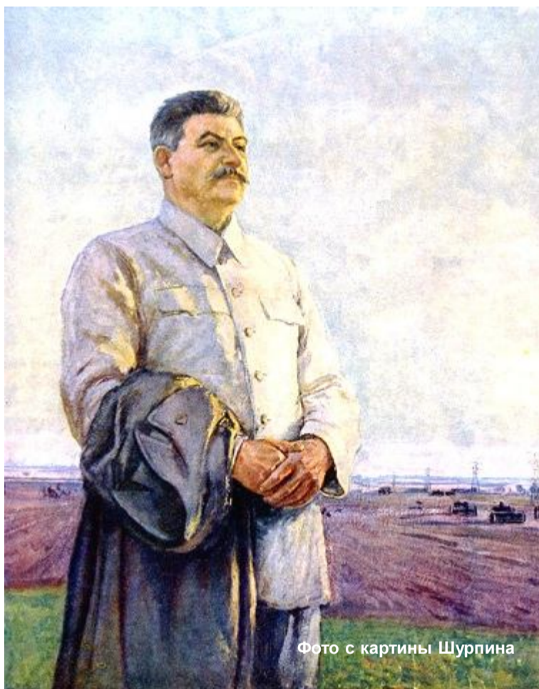
Фото с картины Шурпина