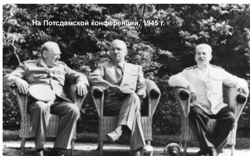
На Потсдамской конференции, 1945 г.

Антони Иден (The Eden Memoirs. London, 1962, p. 153), британский государственный деятель, дипломат