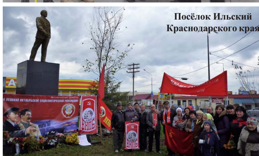
Посёлок Ильский Краснодарского края