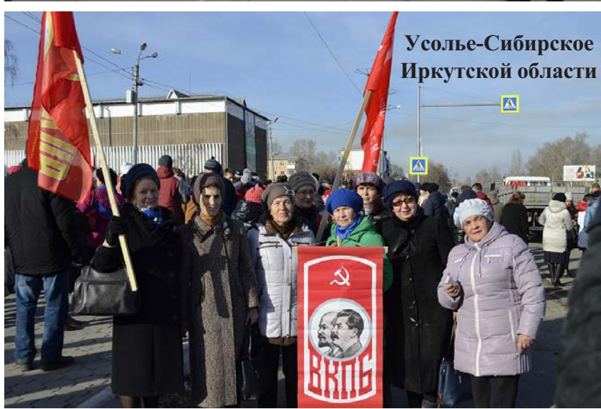
Усолье-Сибирское Иркутской области