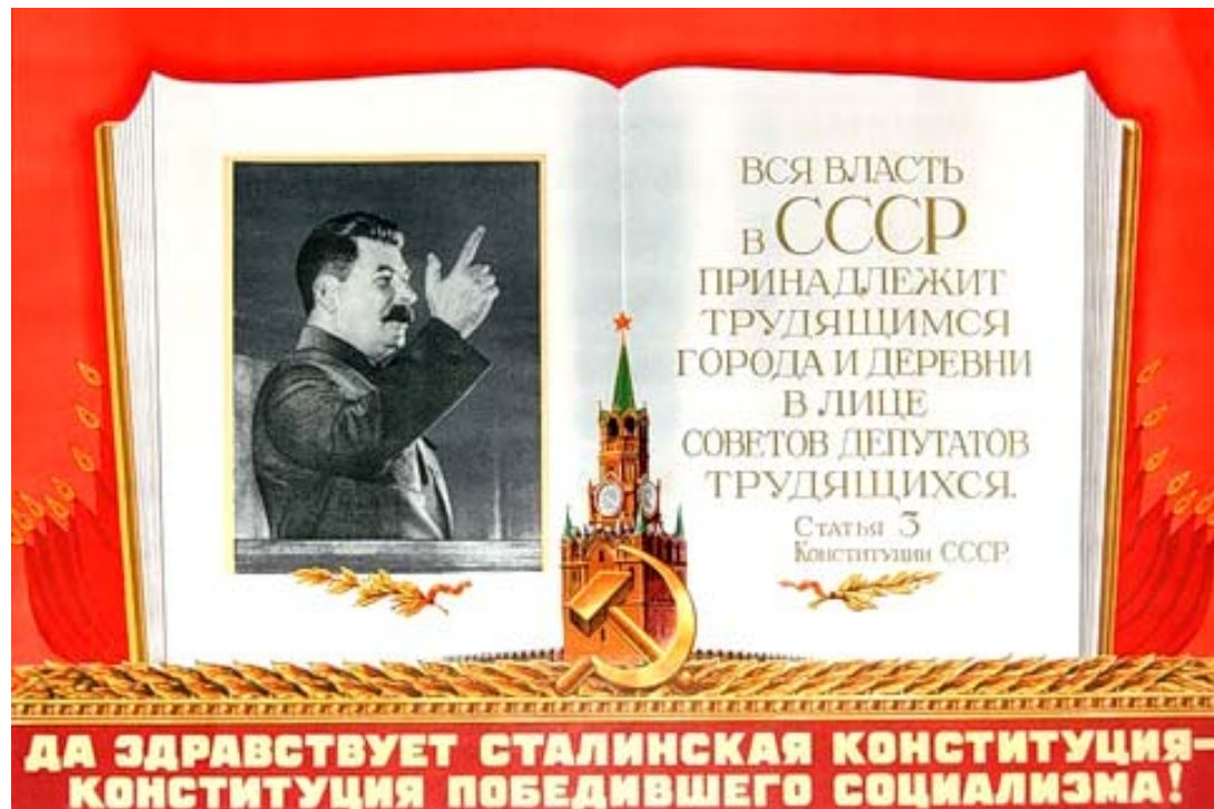
ДА ЗАДРАВСТВУЕТ СТАЛИНСКАЯ КОНСТИТУЦИЯ – КОНСТИТУЦИЯ ПОБЕДИВШЕГО СОЦИАЛИЗМА!

30 декабря исполняется 95 лет со дня создания СССР. К этой дате мы публикуем материал о самом сложном периоде борьбы советской власти с врагами Социалистического Отечества, воспоминания о котором предатели и либералы сопро-