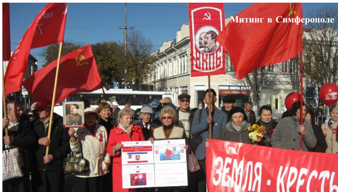
Митинг в Симферополе