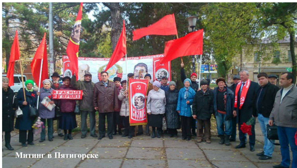
Митинг в Пятигорске

7 ноября во многих городах России ВКПБ приняла участие в мероприятиях, посвящённых 101-й годовщине Великой Октябрьской социалистической революции.