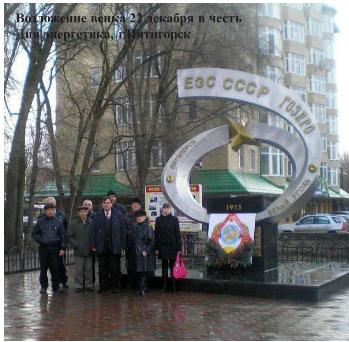
Возложение венка 22 декабря в честь Дня энергетика, г.Ягегорак

Восьмой съезд Советов РСФСР, состоявшийся в 20-х числах декабря 1920 года, впервые, после мировой и гражданской войн, огласил мирную политику развития социалистического государства на пути к коммунизму. Политика эта исходила из необходимости выполнения двух Программ партии: Советская власть плюс электри-