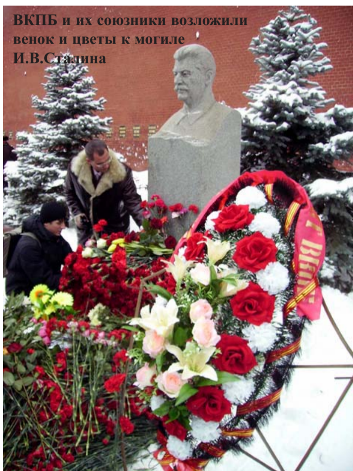
ВКПБ и их союзники возложили венок и цветы к могиле И.В.Сталина

В Москве, Красноярске, Новосибирске, Воронеже, Архангельске, Пятигорске и других городах СССР большевики и их союзники провели мероприятия, посвященные 131-й годовщине со дня рождения И.В.Сталина.