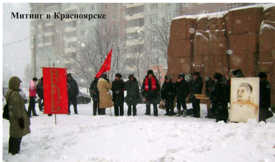
Митинг в Красноярске

Мероприятие закончилось просмотром документальных фильмов о И.В.Сталине. Учреждена Общественная организация «Сталинская правда», тем самым положено начало консолидации всех сил, выступающих за Социализм.