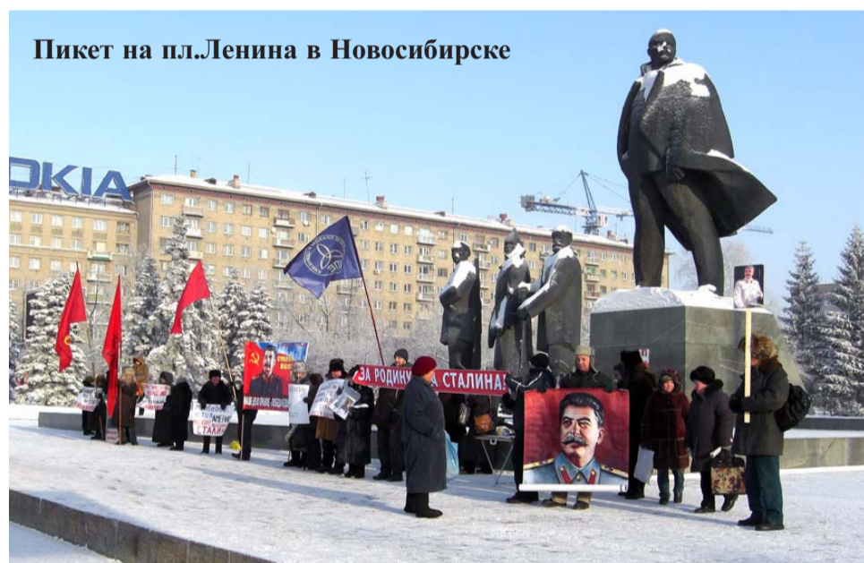
Пикет на пл.Ленина в Новосибирске

В Новосибирске и Красноярске акции были посвящены не только дню рождения И.В.Сталина. В 30-35-градусный мороз ВКПБ и их союзники вышли выразить протест против кампании «десталинизации общественного сознания», заявленной «советом по правам человека» при президенте РФ. В Новосибирске участники акции развернули портреты И.В.Сталина с лозунгами «Сталин – наше знамя боевое!», «За Родину, За Сталина!» и плакаты «Коммунистическую идеологию, господа империалисты, вам не уничтожить!», «Десталинизация не пройдет!», «Народ голосует За Сталина» и др.