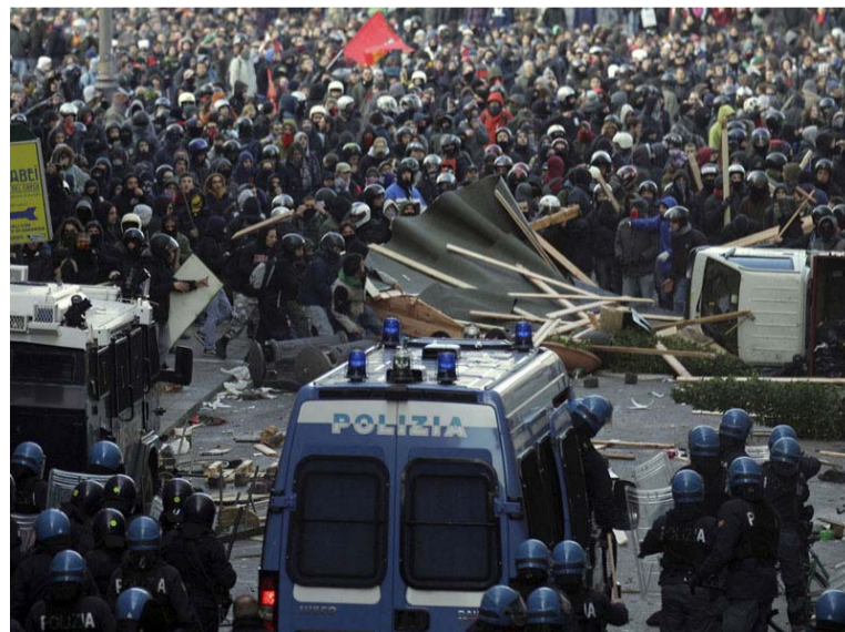
На фотографии: Италия, Рим, 14 декабря. В манифестации приняло участие более 100 тыс. студентов

В Англии, Италии и Греции, особенно в столицах этих государств, прошли массовые выступления студентов, школьников и преподавателей против политики правительств по сокращению расходов на образование и увеличению платы за обучение. Манифестации протеста переросли в ожесточенные столкновения молодежи с полицией.