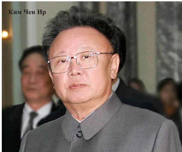
Ким Чен Ир

Площадь этого острова составляет всего 6,8 квадратных километров, а длина окружности – приблизительно 18 км. На этом маленьком острове расположена бригада морской пехоты и больше одной батареи самоходной пушки «К – 9» марионеточной южнокорейской армии. Он густо покрыт локаторами и информационно-связными сооружениями. И остров является важным укрепленным военным пунктом, по заверению марионеточной клики, срыва «районом первой сторожевой категории».