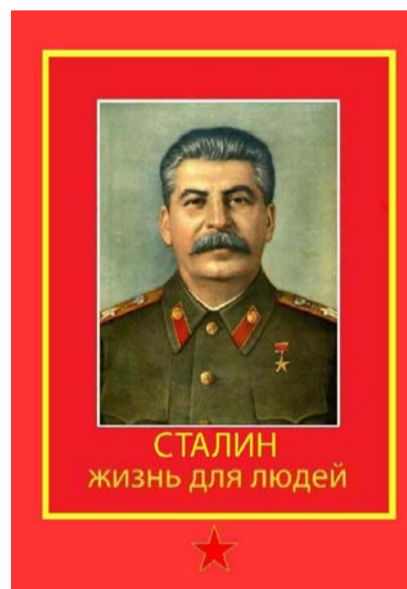
СТАЛИН жизнь для людей