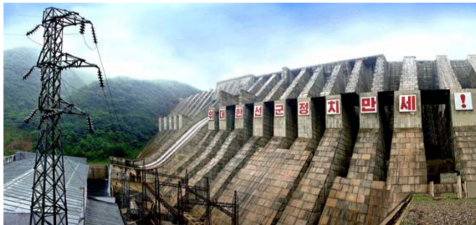
Несмотря на сложную военно-политическую ситуацию в приграничных районах КНДР корейский народ с энтузиазмом продолжает строить свое социалистическое государство и крепить оборону страны

Не жить на этой земле и под этим небом всем тем, кто посмеет хоть на йоту посягнуть на высшее достоинство КНДР.