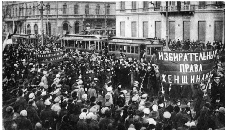
Демонстрация женщин в Петрограде, 23 февраля (8 марта) 1917 года

В России восьмого марта принято поздравлять всех женщин и девочек с праздником, дарить им подарки. В торжество роскоши, красоты и дорогих подарков представительницам «слабого пола» этот день превратили торговцы, умело использующие достижения буржуазной пропаганды – чтобы продать как можно больше цветов, косметики и других товаров.