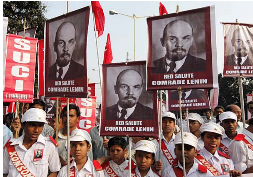
Активисты Центра социалистического единства Индии (Socialist Unity Centre of India, SUCI) провели акцию против премьер-министра России Владимира Путина в Калькутте, держа в руках портреты лидера социалистической революции Владимира Ленина.