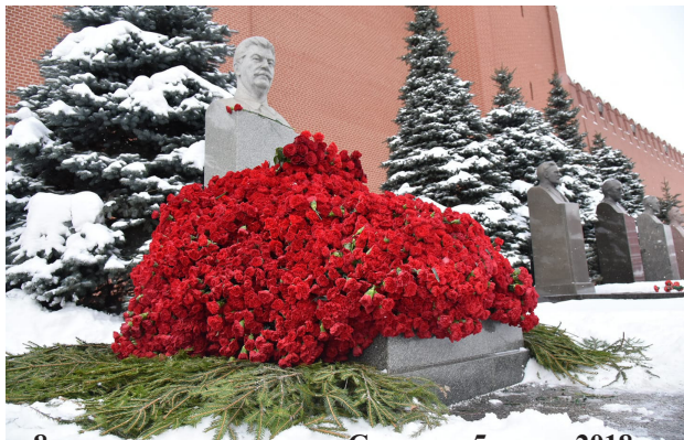
8 тыс. гвоздик у могилы Сталина. 5 марта 2018 г.