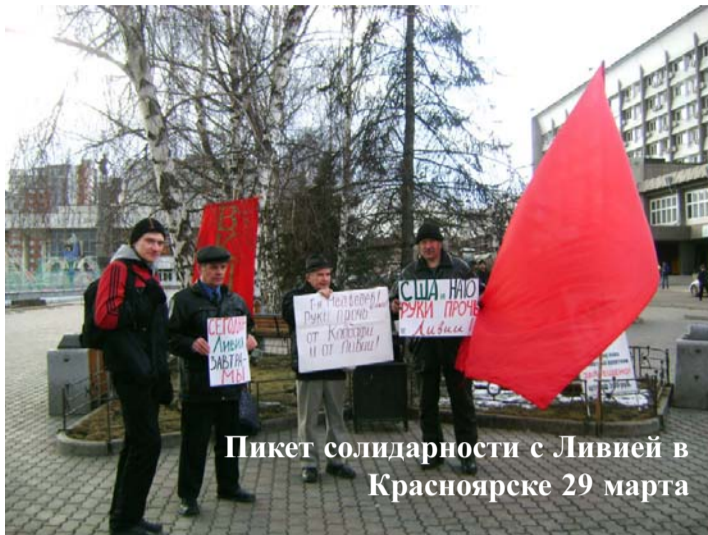
Пикет солидарности с Ливией в Красноярске 29 марта

Выступавшие на митинге, как правило, завершали свои выступления призывами: «Руки прочь от Ливии», «Держись, Каддафи». ВКПБ провела пикеты и митинги в поддержку ливийского народа и в других городах России.