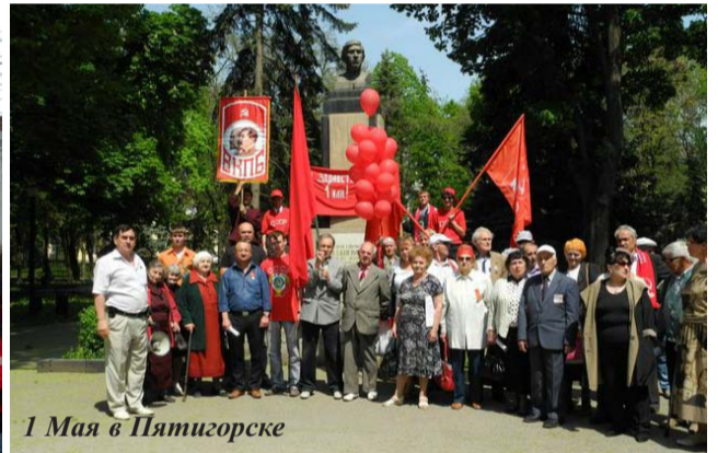
1 Мая в Пятигорске