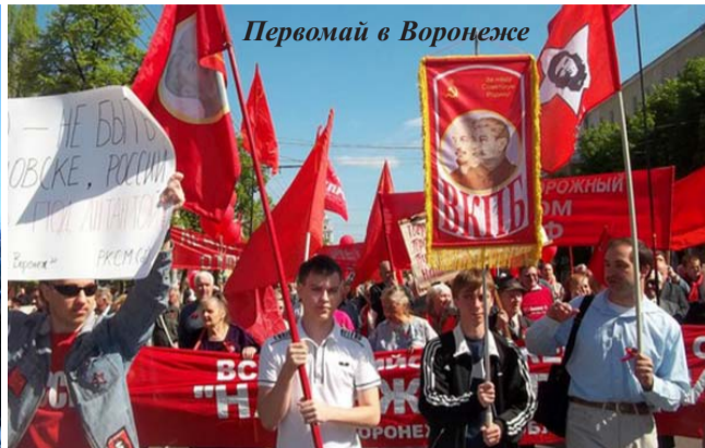
Первомай в Воронеже