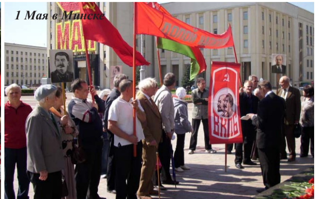
1 Мая в Минске