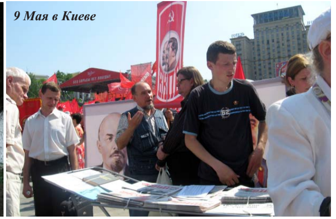
9 Мая в Киеве