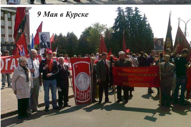
9 Мая в Курске