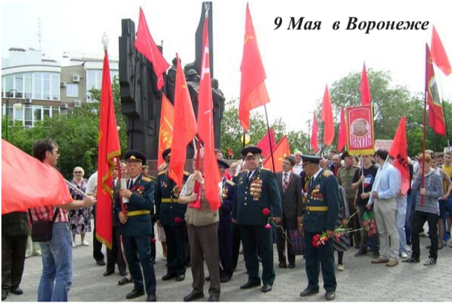
9 Мая в Воронеже