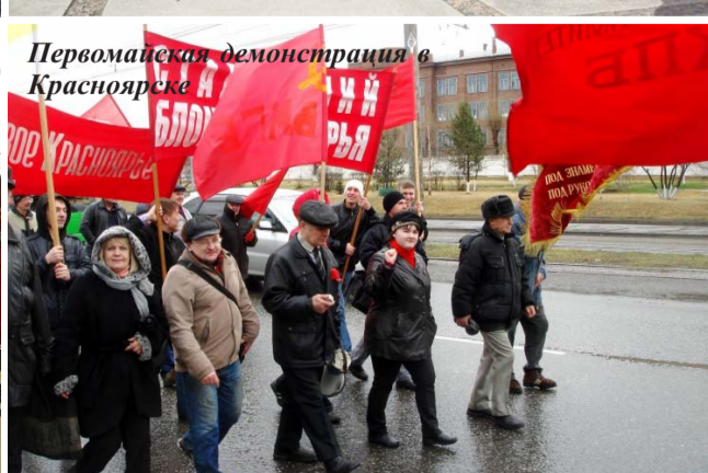
Первомайская демонстрация в Красноярске