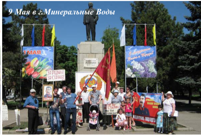
9 Мая в г.Минеральные Воды