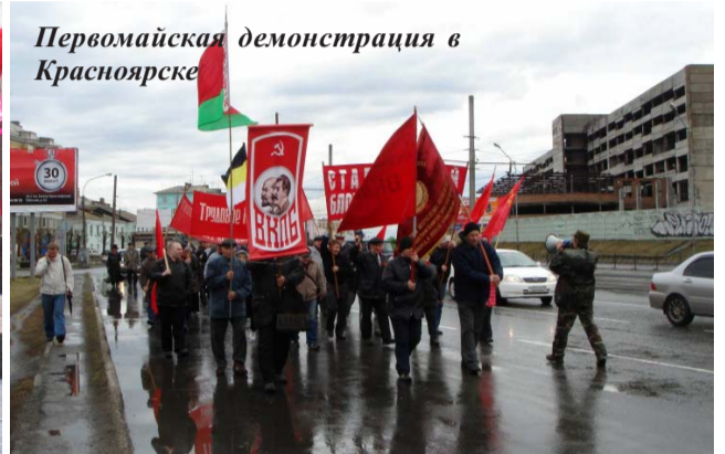
Первомайская демонстрация в Красноярске