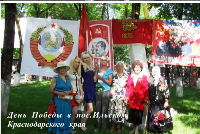
День Победы в пос.Ильском Краснодарского края