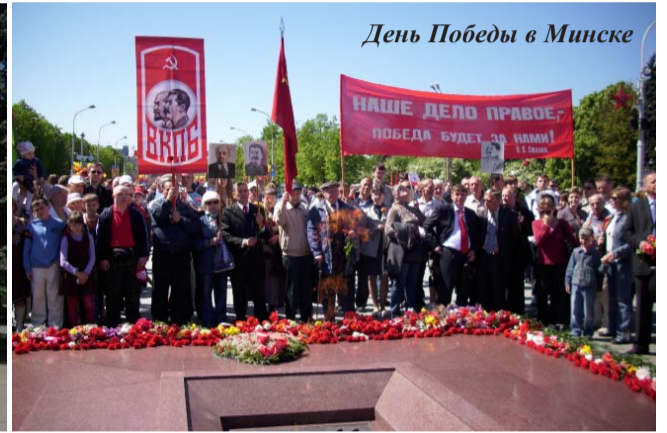
День Победы в Минске