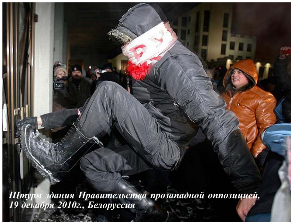
Штурм здания Правительства прозападной оппозицией, 19 декабря 2010г., Белоруссия

Неуступчивость белорусского лидера вызывает бешеную злобу империалистического Запада, который хотел бы бесконтрольно хозяйничать в нашей республике . Вот, собственно, подлинные причины «нарушений прав человека в Белоруссии», которые не дают покоя за-