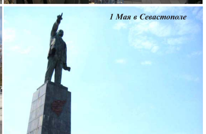
1 Мая в Севастополе