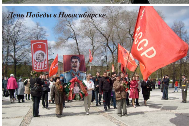
День Победы в Новосибирске