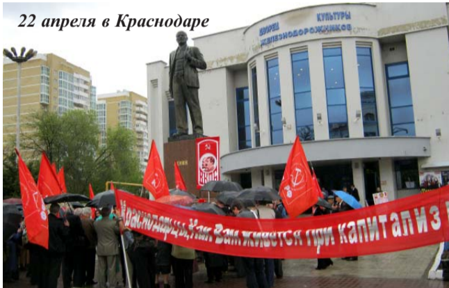
22 апреля в Краснодаре