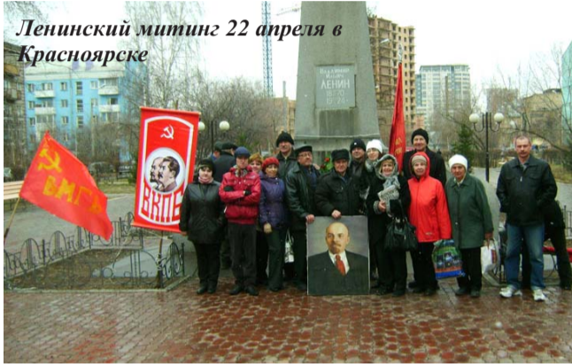
Ленинский митинг 22 апреля в Красноярске