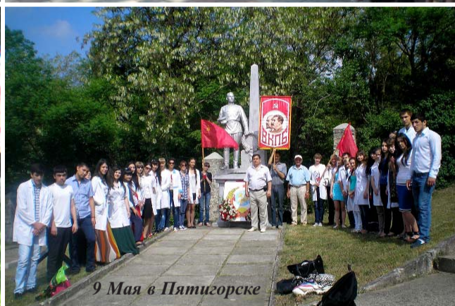
9 Мая в Пятигорске