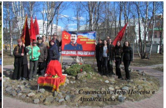
Советский День Победы в Архангельске