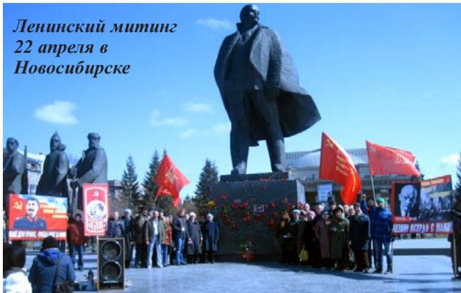
Ленинский митинг 22 апреля в Новосибирске

22 апреля – в День рождения В.И.Ленина, 1 Мая – в День международной солидарности трудящихся и 9 Мая – в ДЕНЬ ПОБЕДЫ! – Большевики во многих городах России, Белоруссии и Украины провели массовые мероприятия!