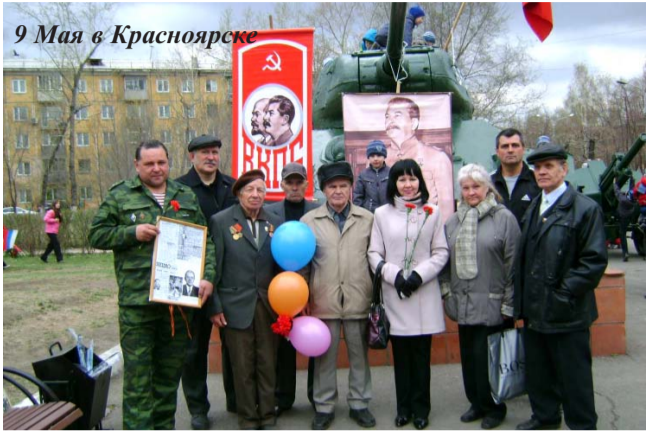
9 Мая в Красноярске

22 апреля – в День рождения В.И.Ленина, 1 Мая – в День международной солидарности трудящихся и 9 Мая – в ДЕНЬ ПОБЕДЫ! – Большевики во многих городах России, Белоруссии и Украины провели массовые мероприятия!