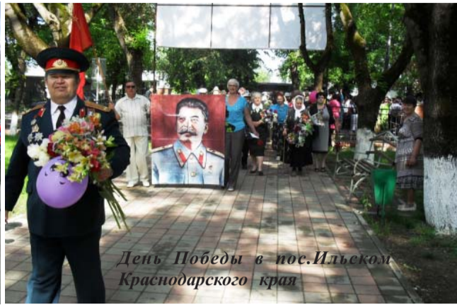
День Победы в пос.Ильском Краснодарского края