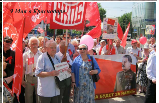
9 Мая в Краснодаре