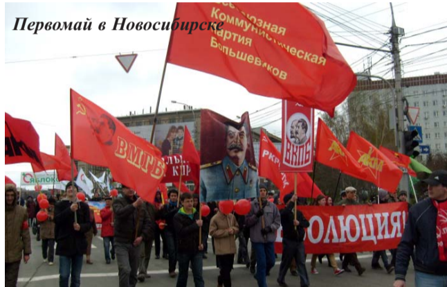
Первомай в Новосибирске