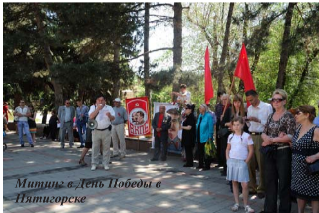
Митинг в День Победы в Пятигорске