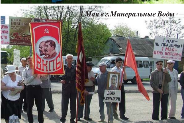
1 Мая в г.Минеральные Воды