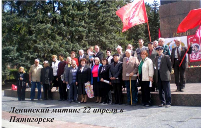
Ленинский митинг 22 апреля в Пятигорске