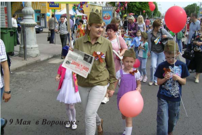
9 Мая в Воронеже