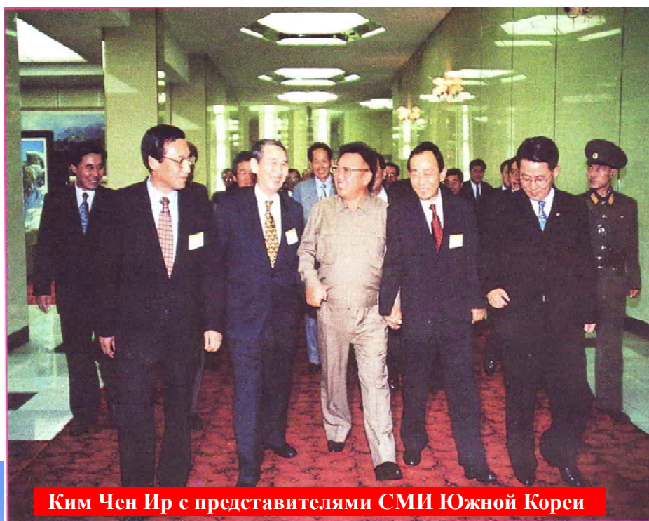
Ким Чен Ир с представителями СМИ Южной Кореи

Согласно Конституции высшим органом власти в КНДР является Верховное Народное Собрание. Между сессиями ВНС постоянно действующим органом является Постоянный Совет ВНС. Ныне действующая Конституция КНДР была принята на I сессии ВНС КНДР пятого созыва 27 декабря 1972 г. В дальнейшем (на сессиях ВНС КНДР - 9 апреля 1992 г. и 5 сентября 1998 г.) в неё были внесены некоторые изменения и дополнения в связи с развитием государственности и некоторым изменением государственной структуры власти, что вполне естественно для