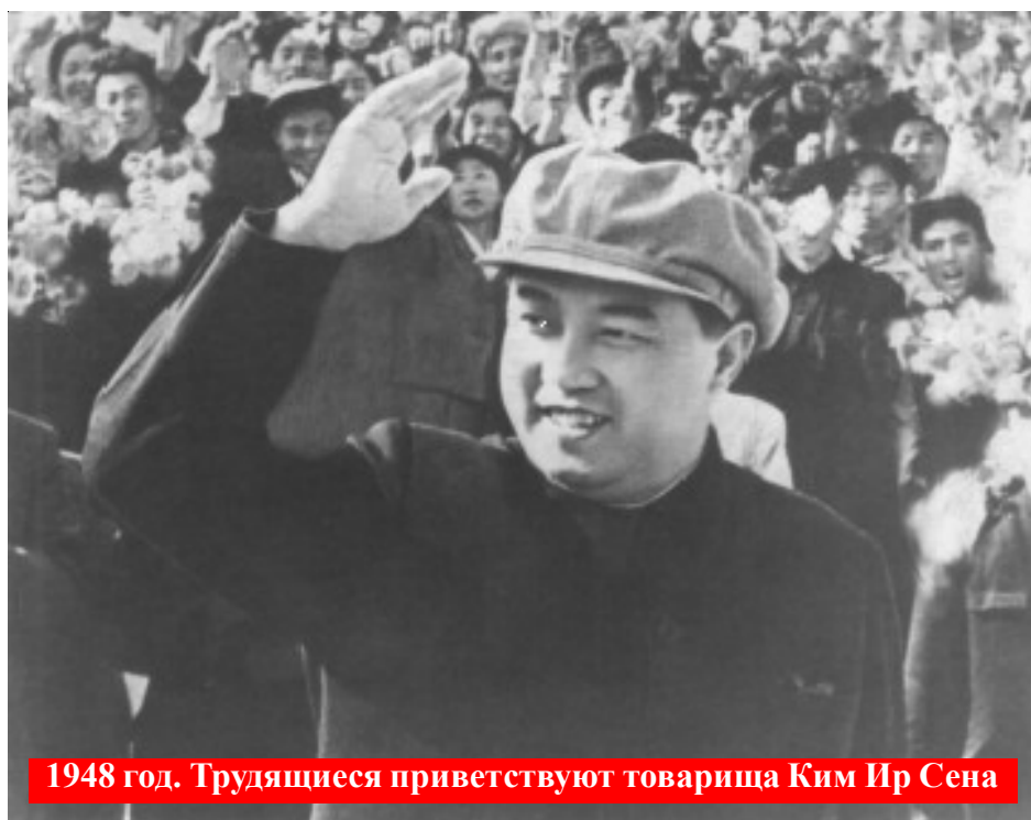
1948 год. Трудящиеся приветствуют товарища Ким Ир Сена

развивающегося социалистического государства. Социалистическая Конституция КНДР называется Кимирсеновской Конституцией, юридически зафиксировавшей идеи Великого Вождя о государственном