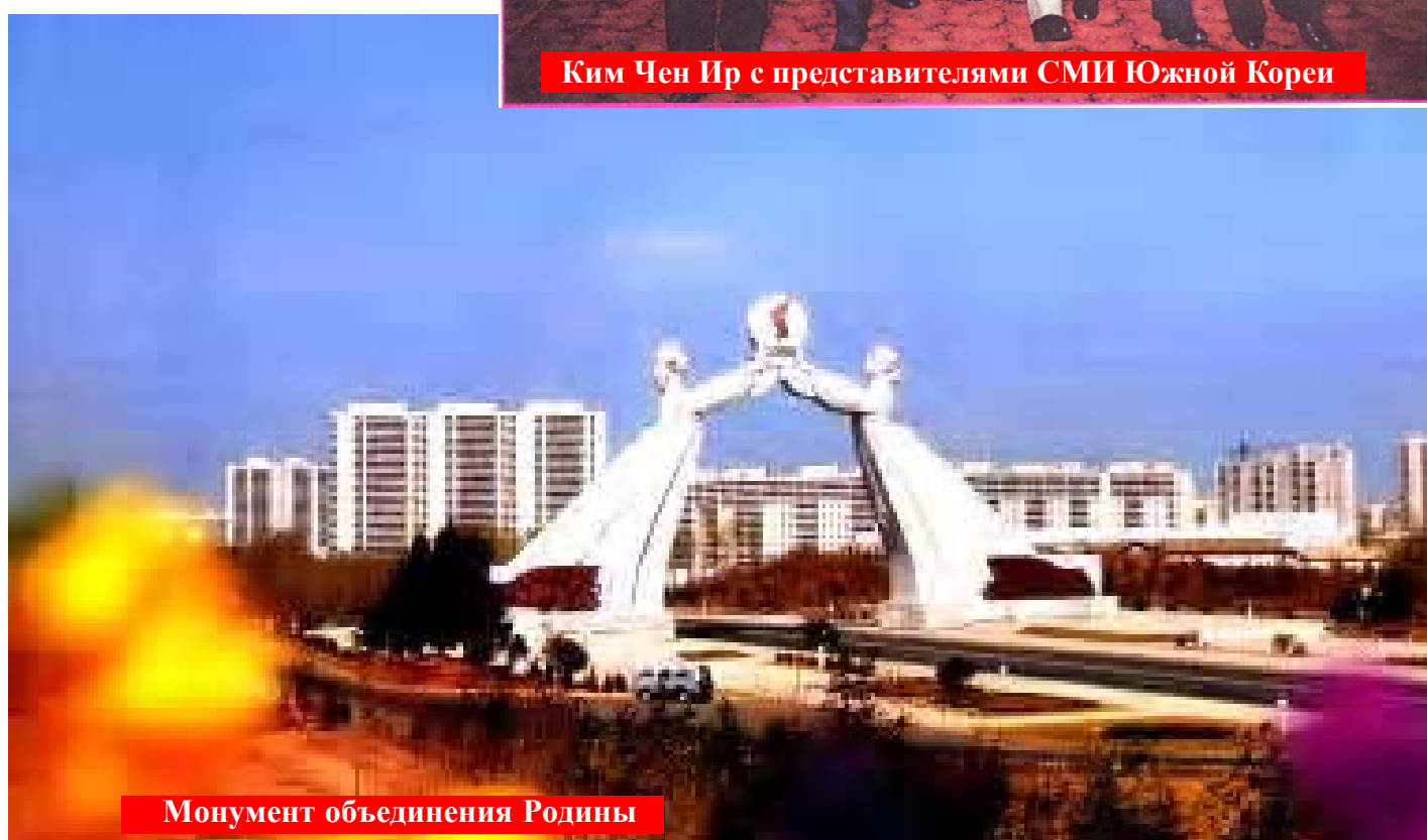
Монумент объединения Родины