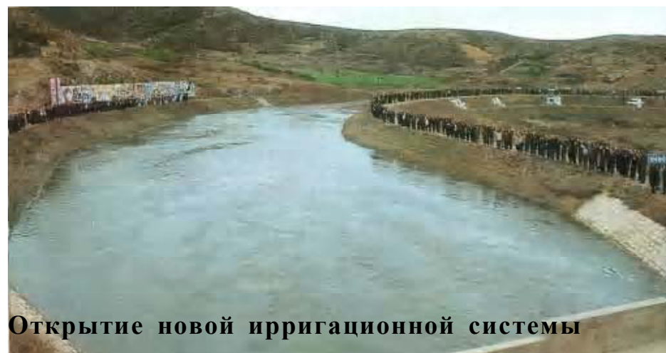
Открытие новой ирригационной системы

Демократическая политическая партия крестьян (ПЧК) создана 8 февраля 1946 г. Её Программа мало отличается от Программы СДПК и,