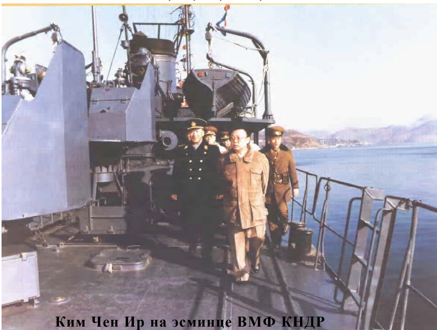
Ким Чен Ир на эсминце ВМФ КНДР

Союз социалистической трудовой молодёжи Кореи (ныне – Кимирсеневский Союз молодёжи ) основан 17 января 1946 г., является массовой политической организацией молодёжи. Как боевая организация молодёжи, призванная принять эстафету революции, КСМ является надёжным резервом и помощником ТПК,