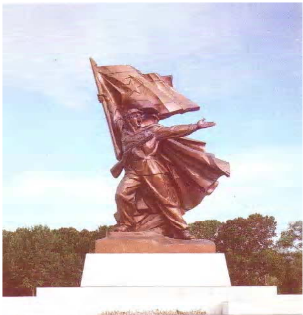
Главная скульптура монумента в честь победы в Отечественной освободительной войне 1950-1953 г.г.

социально-экономическая база эксплуатации и положено начало переходу к социализму. Установлены новые, социалистические производственные отношения в КНДР, направленные на подъем благосостояния трудящихся - всего народа. Высшим принципом государственной и партийной деятельности в КНДР является постоянное улучшение материальной и культурной жизни народа.