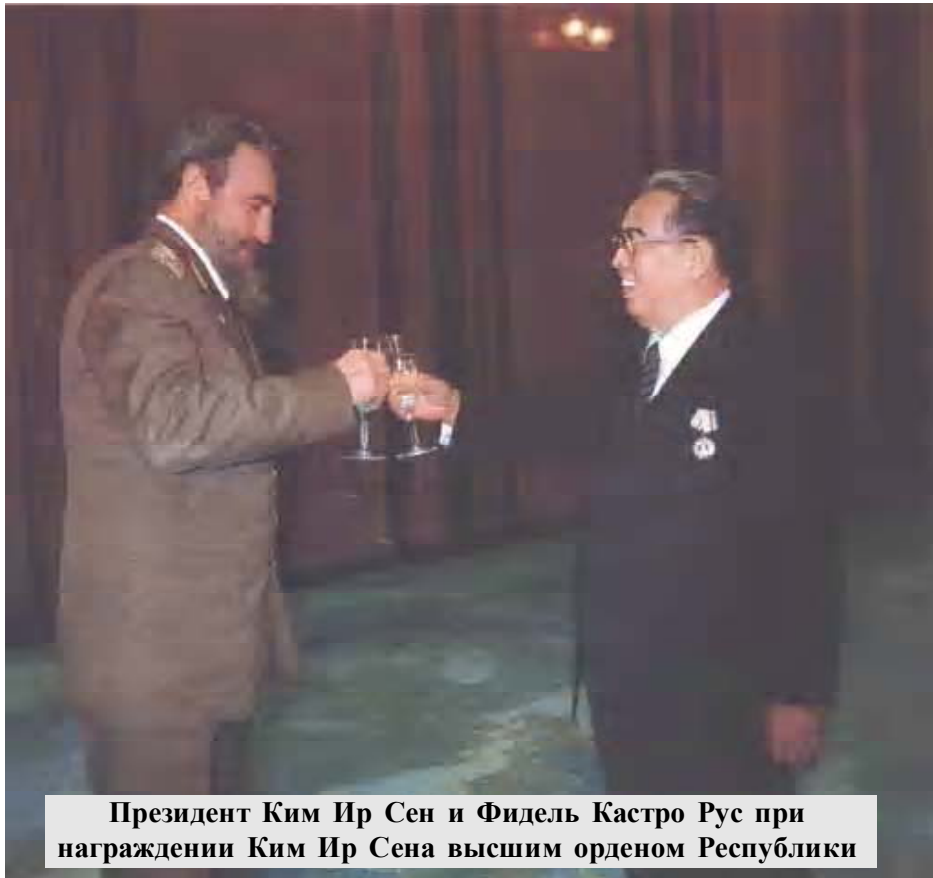
Президент Ким Ир Сен и Фидель Кастро Рус при награждении Ким Ира Сена высшим орденом Республики

строительстве и достижения в построении социализма.