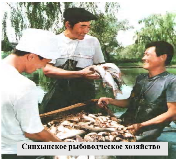
Синхынское рыбноводческое хозяйство