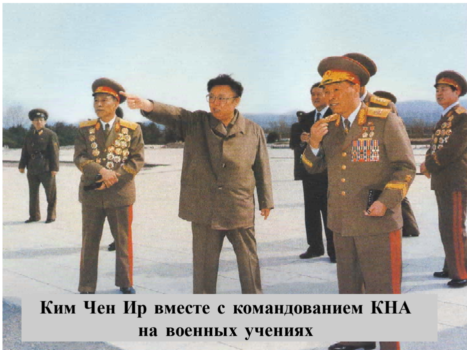
Ким Чен Ир вместе с командованием КНА на военных учениях

комплексом, обуславливающим укрепление оборонной мощи страны. Это имеет наиважнейшее значение в условиях 60-летнего противостояния США, постоянно угрожавших КНДР нанесением по ней превентивного ядерного удара. Научно-исследовательские разработки корейских учёных, создание последнее время баллистических ракет средней дальности, способных достичь территории США и оснащенных ядерными боеголовками (разработки также корейских учёных), значительно охладили военно-авантюрный пыл Америки, что дало возможность в нынешних условиях народу КНДР более спокойно жить и работать, продвигая вперёд дело трёх корейских революций – идеологической, технической и культурной на пути к полной победе социализма в КНДР.