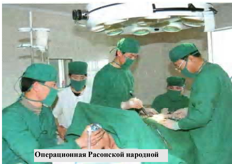
Операционная Расонской народной

В Социалистической Корее господствует весьма уважительное и очень бережное отношение к своим культурным и национальным ценностям, к своей истории. Много тематических музеев и выставок. В КНДР создано и создаются прекрасные памятники современной эпохи – память грядущим поколениям о трудной борьбе за освобождение страны и утверждение нового социально-политического строя – социализма.