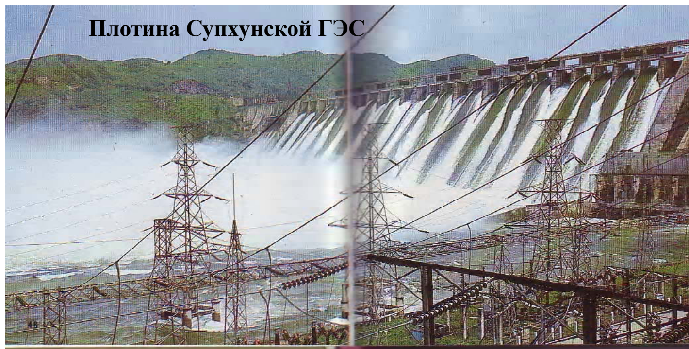
Плотина Супхунской ГЭС

которые действуют во имя торжества дела социализма и коммунизма. ТПК унаследовала славные революционные традиции, заложенные в героической антияпонской борьбе. Самыми главными задачами ТПК являются достижение непрерывного роста благосостояния народа, укрепление могущества Родины, объединение корейской нации.