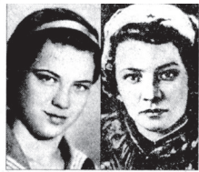
НАТАША КОВШОВА (1920 - 1942) и МАРИЯ ПОЛИВАНОВА (1922 - 1942).