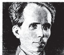
НИКОЛАЙ ОСТРОВСКИЙ (1904 - 1936).