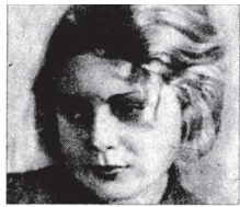
ГУЛЯ КОРОЛЁВА (1922 - 1942).