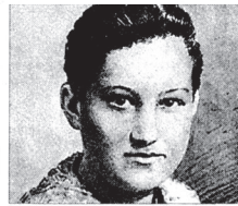
ЗОЯ КОСМОДЕМЬЯНСКАЯ (1923 - 1941).