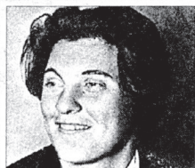
ПРАСКОВЬЯ (ПАША) АНГЕЛИНА (1913 - 1959).