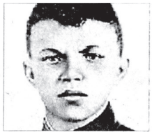
АЛЕКСАНДР МАТРОСОВ (1924 - 1943).

вместе со своими отцами и старшими братьями в ряды защитников Советской Родины. И в далеком тылу, и на переднем крае, и в отрядах народных мстителей они помогали ковать победу над фашизмом. Мы никогда не забудем имена Александра Матросова, Зои Космодемьянской, Николая Гастелло, Виктора Талалихина, молодогвардейцев Краснодона, литовской героини Марии Мельникайте и многих, многих других.