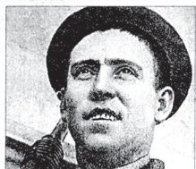
АЛЕКСЕЙ СТАХАНОВ (1906 - 1977).