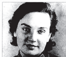
ВАЛЕНТИНА ГРИЗОДУБОВА (1909 - 1993).