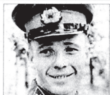
ВИКТОР ТАЛАЛИХИН (1918 - 1941).