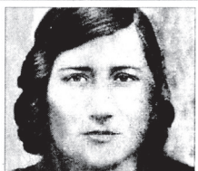
ЛИЗА ЧАЙКИНА (1918 - 1941).