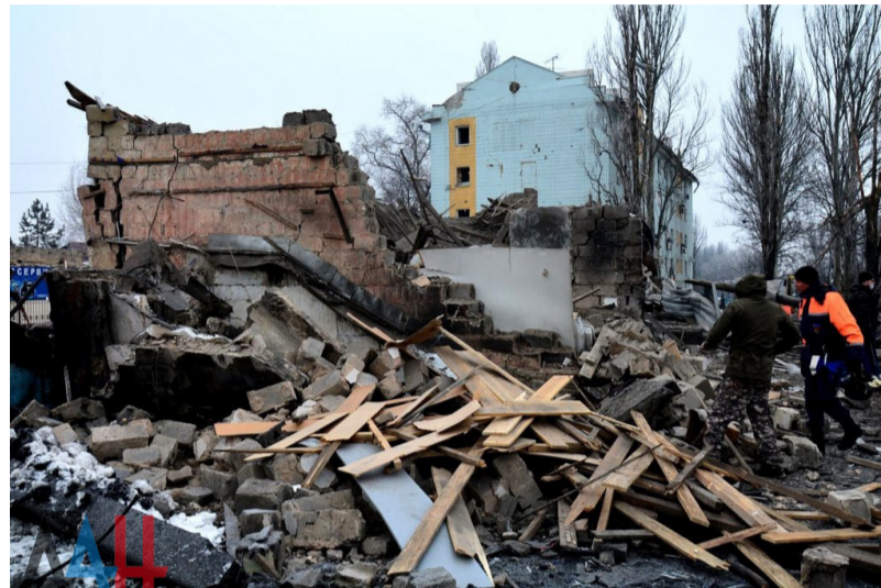
Масштабные разрушения на восточном выезде из Донецка