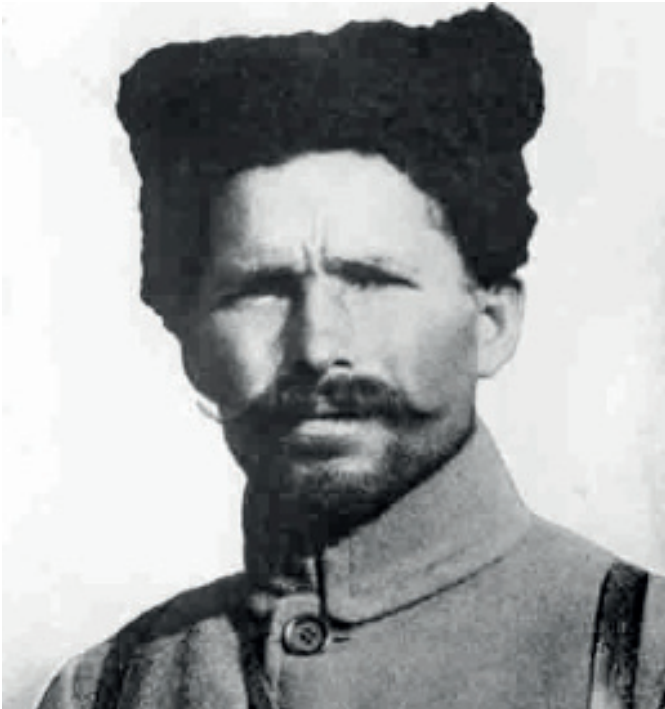
Живой Чапаев в 1918 году