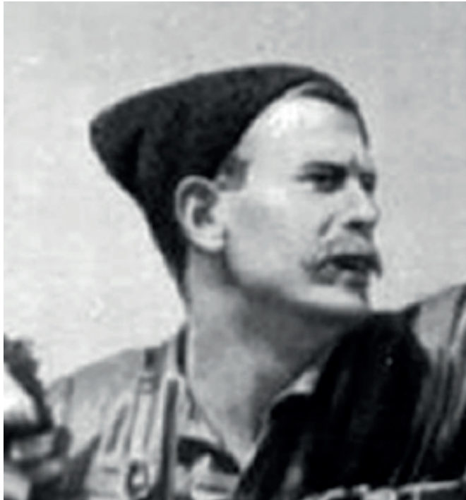
Борис Бабочкин в роли Чапаева в 1934 году