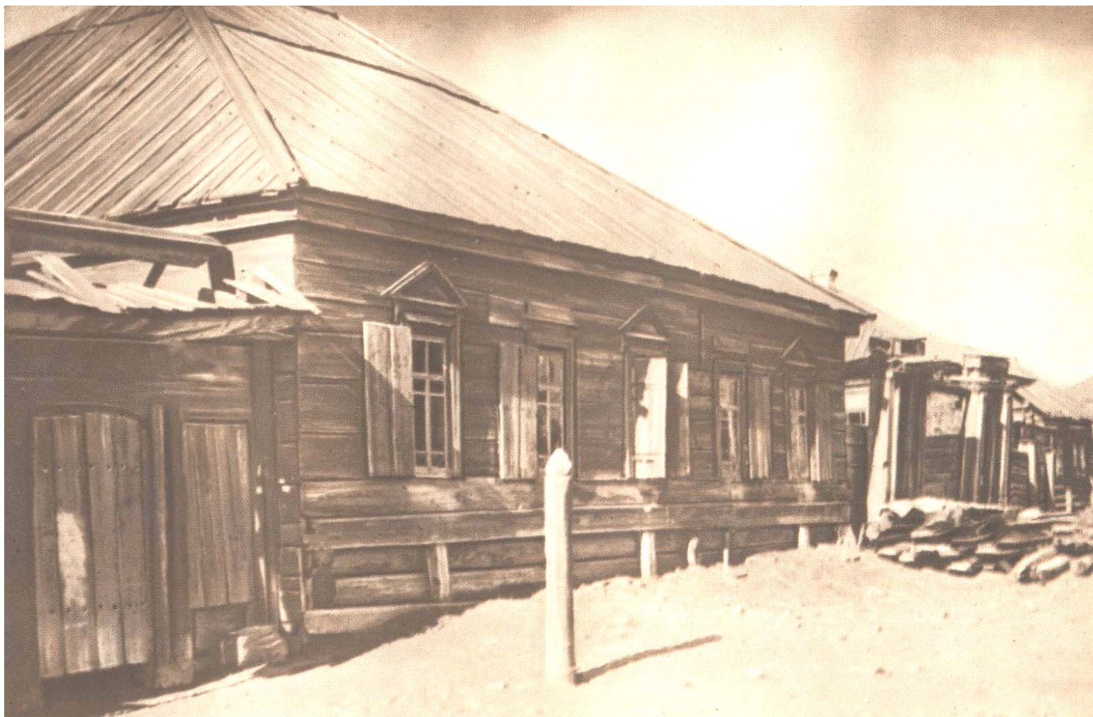
Дом в селе Шушенском, в котором жил во время ссылки В. И. Ленин. Два крайних окна слева — окна комнаты Ленина.