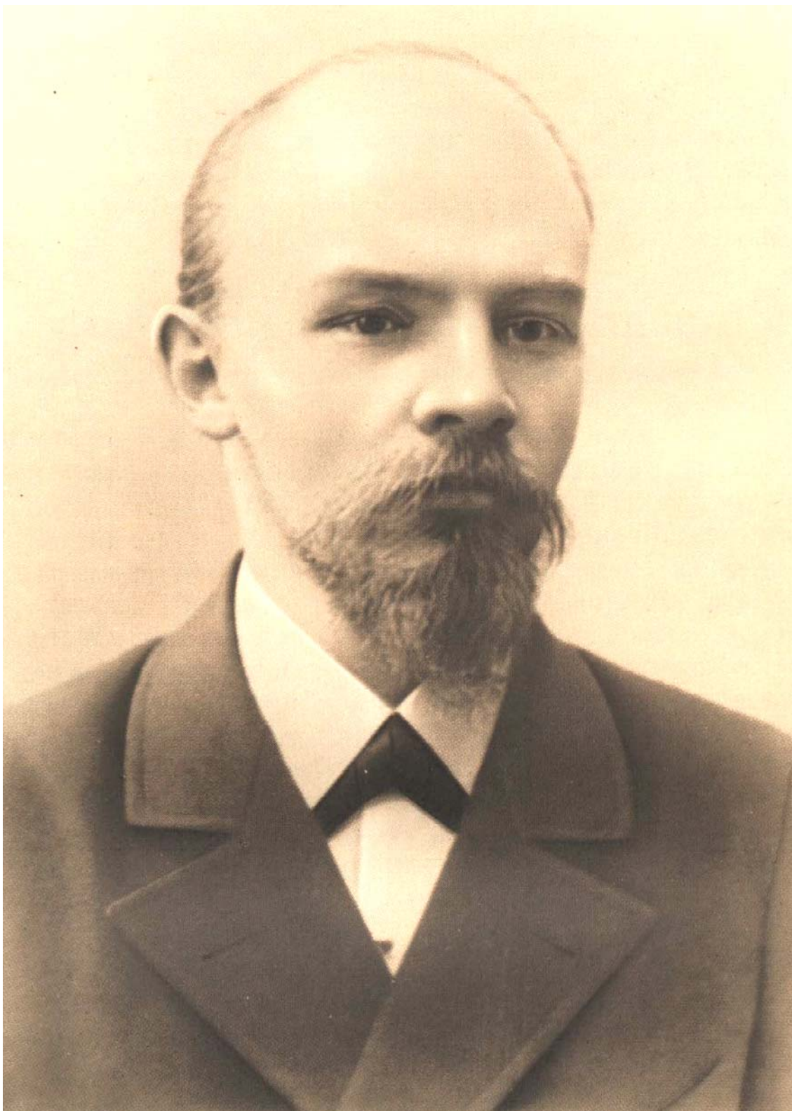
В. И. ЛЕНИН 1897