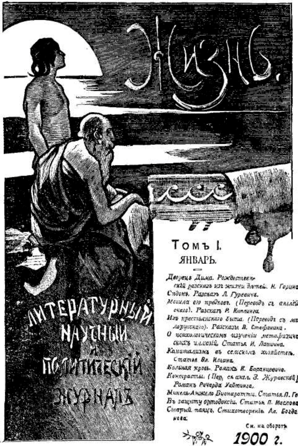
Обложка журнала «Жизнь», в котором была напечатана статья В. И. Ленина «Капитализм в сельском хозяйстве». — 1900 г.