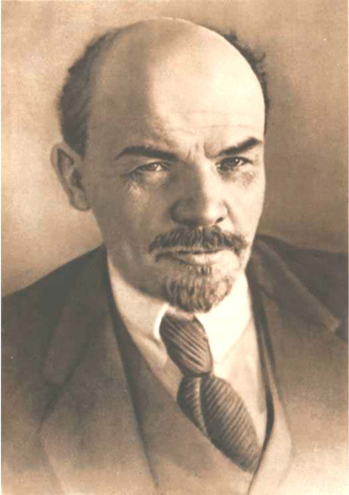
В. И. ЛЕНИН 1918