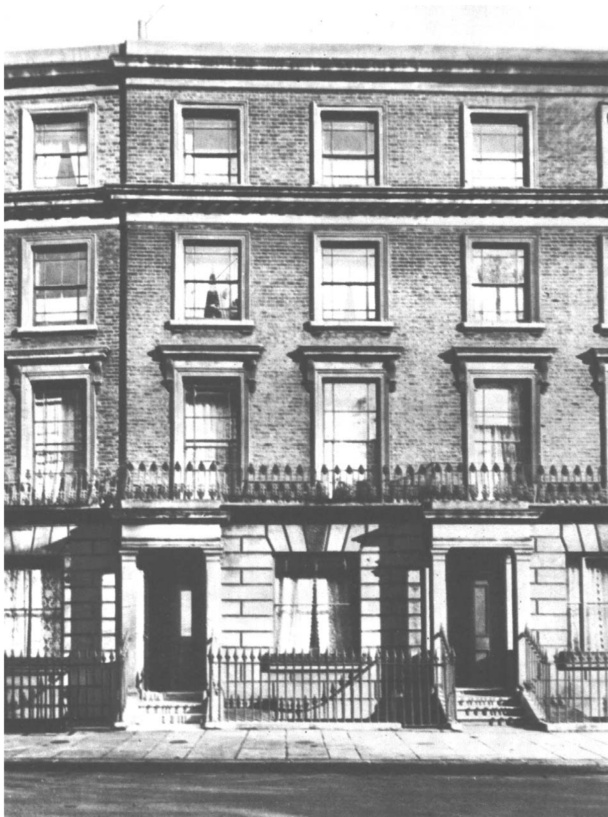
Дом в Лондоне (122, Риджентс-парк-род), в котором жил Энгельс с сентября 1870 по октябрь 1894 г.