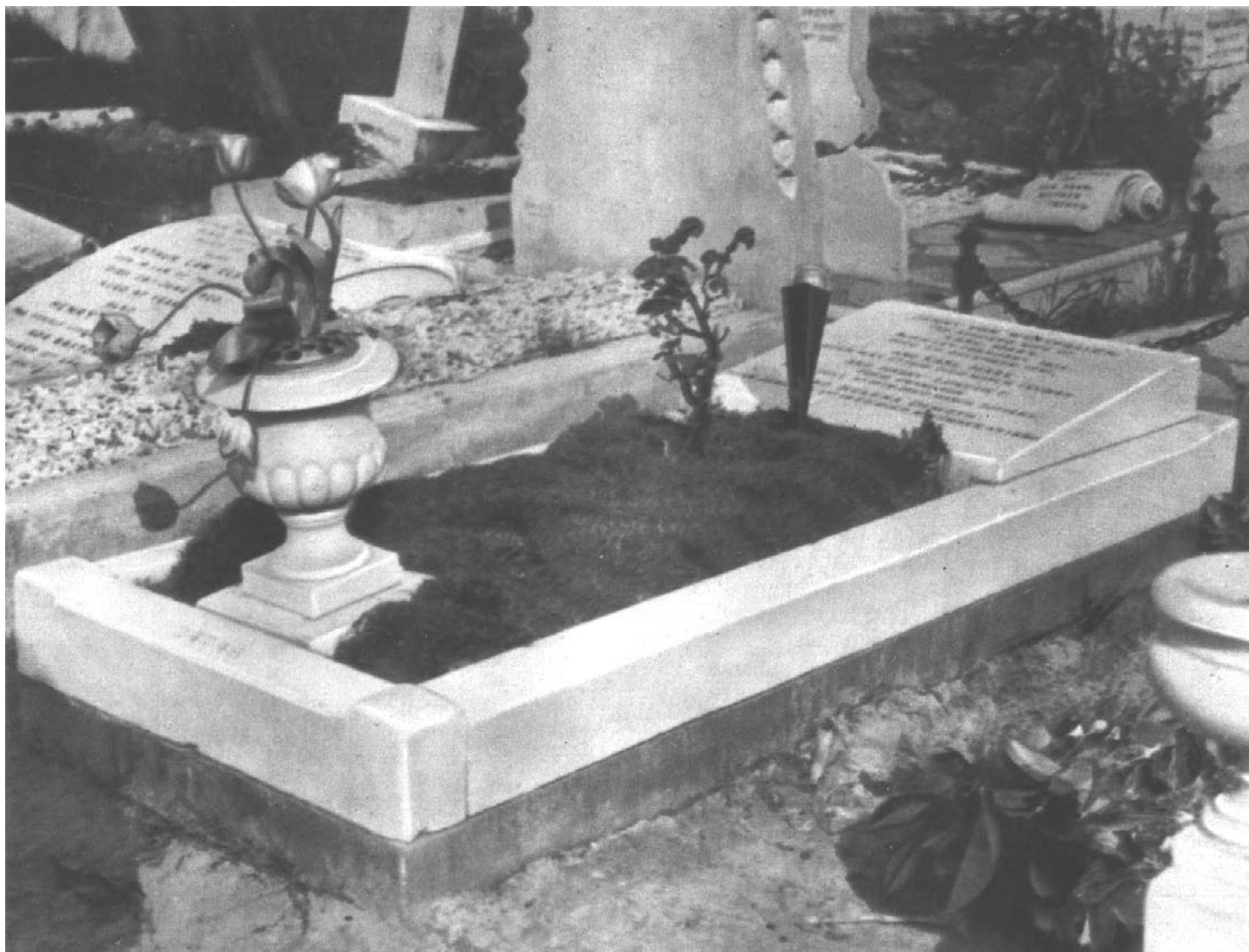
Могила Карла Маркса на Хайгетском кладбище в Лондоне (до сооружения памятника в 1956 г.)