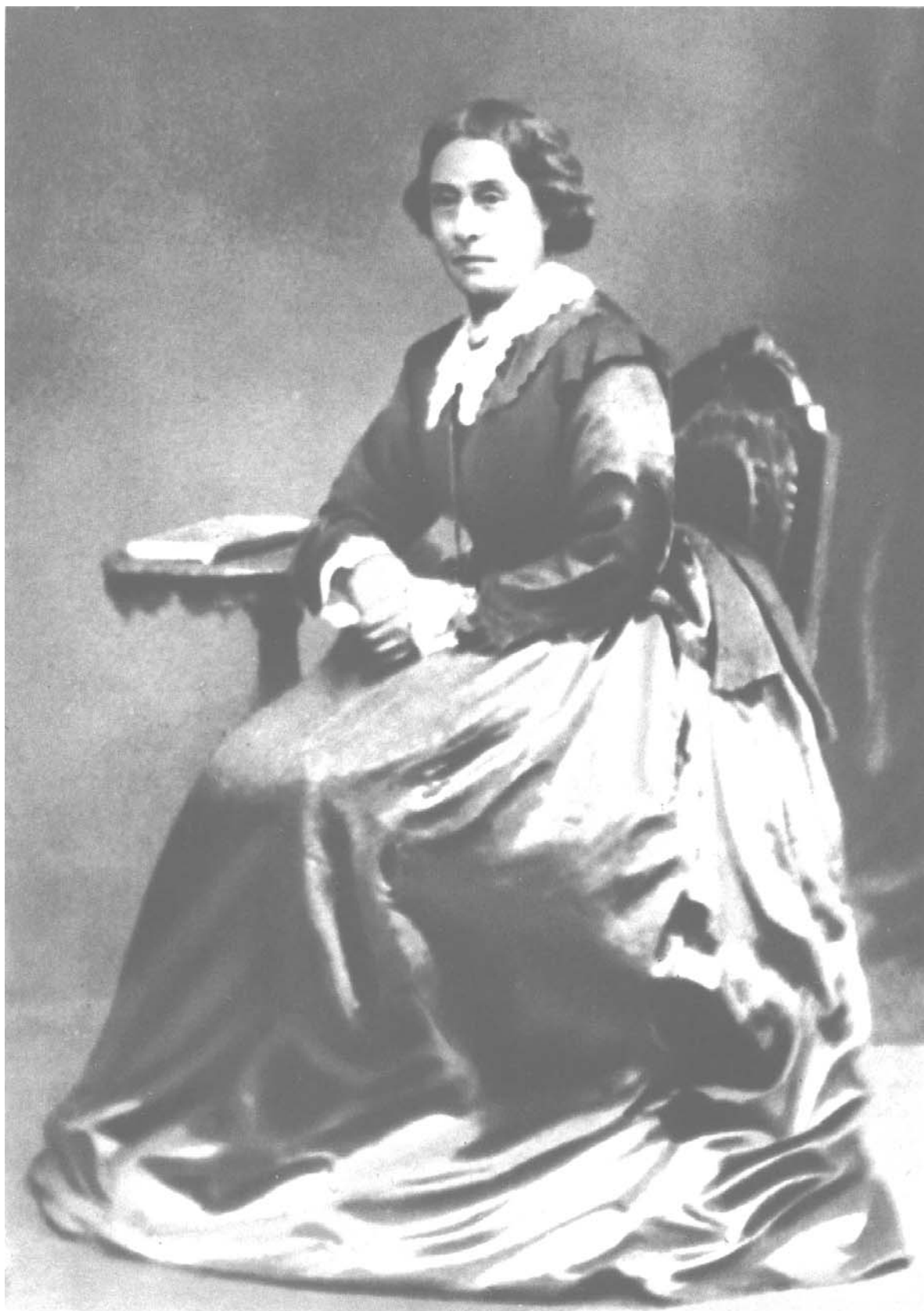
Женни Маркс (в последние годы ее жизни)